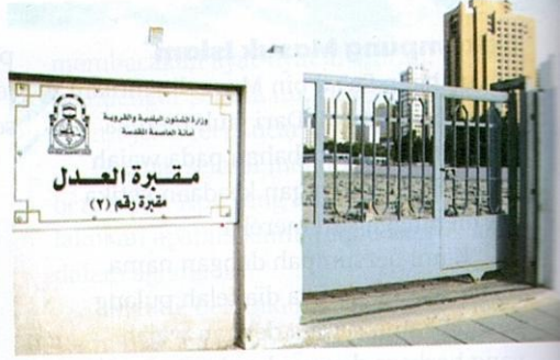
Pintu masuk Perkuburan al-Adl.

1 Perkuburan al-Syubaikah Ia merupakan kawasan perkuburan lama yang sudah ditutup. Sungguhpun begitu, ia merupakan sebuah perkuburan yang masyhur di Makkah serta telah digunakan semenjak zaman