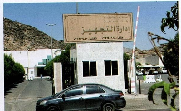
Pintu masuk perkuburan al-Syarai'.