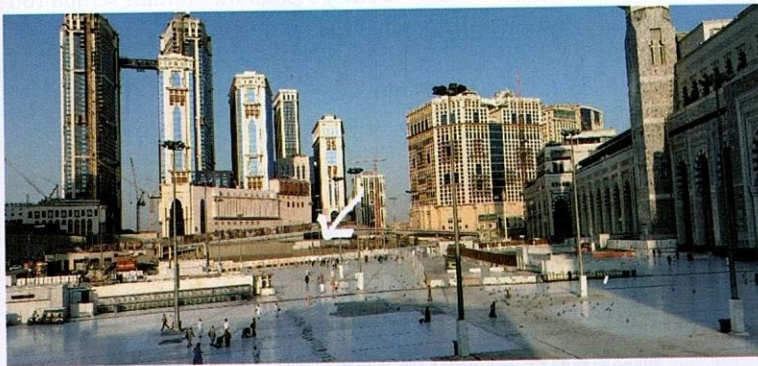
Perkuburan al-Syubaikah dari jauh di kawasan yang bertanda.

“Jika kami dapati mayat itu masih belum hancur dan tetap utuh, kami