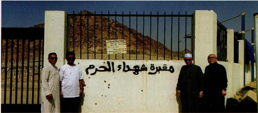
Pintu masuk Perkuburan Syuhada' al-Haram.

akan menutupnya semula sebagaimana asal. Kemudian selepas berlalu tempoh waktu yang sepatutnya, kami akan buka semula kubur tersebut dan jika kami dapati mayat tersebut masih tidak hancur, kami tidak akan sekali-sekali mengusiknya. Sebaliknya menutup kembali kubur itu kemas-kemas.”