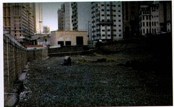
Perkuburan al-Syubaikah dari dekat.