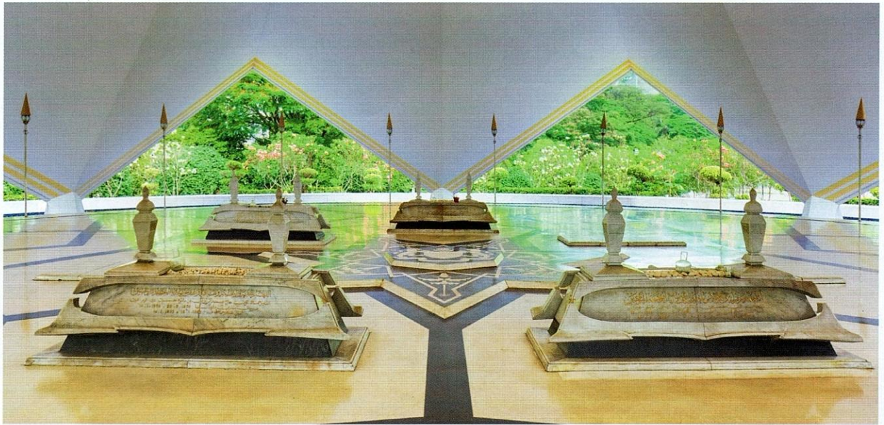
Makam Pahlawan dijadikan sebagai tempat pengebumian khas bagi para pemimpin dan wira negara.

Prinsip kedua, iaitu kenalaran sebagai kaedah utama bagi susun atur, ditampilkan dengan nyata di Masjid Negara dan Masjid Agung Demak, Kabupaten Demak. Penekanan berganda kepada suatu simetri saranan dapat diamati, bukan sahaja di dewan solat, bahkan di ruang sampingan yang tiada satu pun lebih dominan daripada yang lainnya. Ekspresi kasual aneka ruang yang dihimpunkan dalam kompleks bangunan ini tidak bersimetri kerana tiada nalar dalam bentuk dan fungsi, tetapi disatukan dengan munasabah dalam bentuk struktur asimetri tetap. Di Masjid Negara, kolam hiasannya yang berbentuk segi empat tepat dan anjungnya yang terlindung masing-masing mengadang dan memadukan ruang sakral.