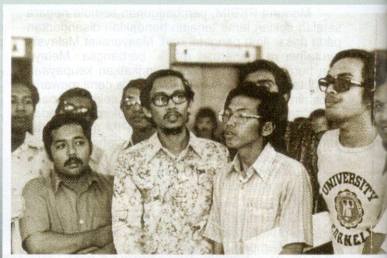
Anwar Ibrahim antara pemimpin PKPIM yang penting semasa dekad 1970-an.

memperjuangkan penubuhan institusi pendidikan relevan dalam konteks negara yang baru sahaja mencapai kemerdekaan.