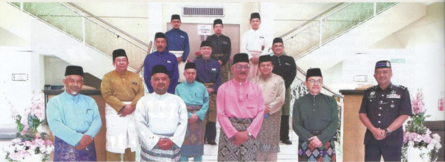
Ahli Majlis Agama Islam Melaka (MAIM).

Sebagai mufti, Datuk Wira menjadi penasihat utama kepada Kerajaan Negeri Melaka yang dihormati. Beliau mempunyai perancangan untuk memantapkan gagasan dalam perjuangan "Melakaku, Maju Jaya" bagi mendapat sokongan dan melibatkan para ilmuwan yang berpengalaman dalam usaha memantapkan perjuangan MAIM dan Jabatan Agama Islam Melaka dalam arus pembangunan Melaka yang seimbang antara ekonomi dengan seni budaya dan warisan. Cadangan beliau sangat dihormati dan diguna pakai bagi memantapkan pembangunan insan dan masyarakat dengan mewujudkan pelbagai pengerusi jawatankuasa bagi memantau pembangunan negeri Melaka demi kesejahteraan dan kepentingan umat Islam dan rakyat negeri Melaka.