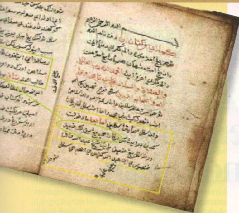
Manuskrip tertua di Nusantara bertajuk "Al-'Aqa'id al-Nasafi" karangan Imam Najmuddin al-Nasafi pada abad ke-16 Masihi.

di rantau ini berasaskan akidah Maturidiyyah yang bernaung di bawah aliran Ahli Sunah Waljamaah.