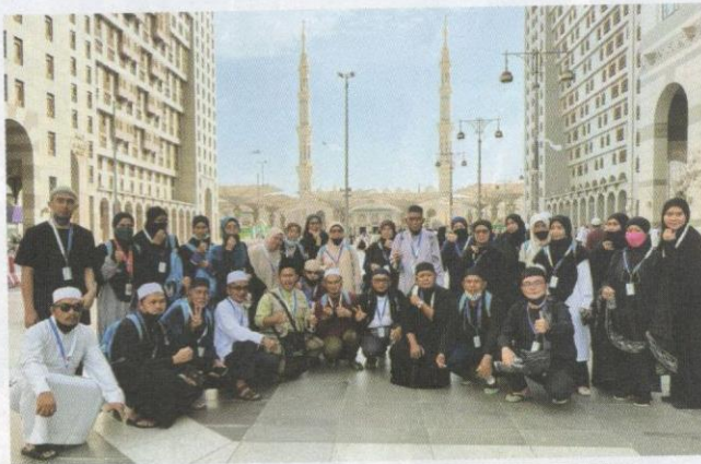
Hubungan silaturahmi yang terjalin ketika mengerjakan haji akan berterusan selepas kembali ke tanah air.

Selain menahan diri untuk mendidik rohani, penjagaan diri di Tanah Suci juga meliputi penjagaan kesihatan akibat perubahan cuaca dan persekitaran. Sebelum berangkat mengerjakan haji, bakal haji diwajibkan untuk menerima suntikan vaksin bagi meningkatkan sistem imun badan daripada dijangkiti pelbagai penyakit. Keadaan yang padat di Tanah Suci memungkinkan jemaah terdedah dengan pelbagai jenis penyakit. Menjadi