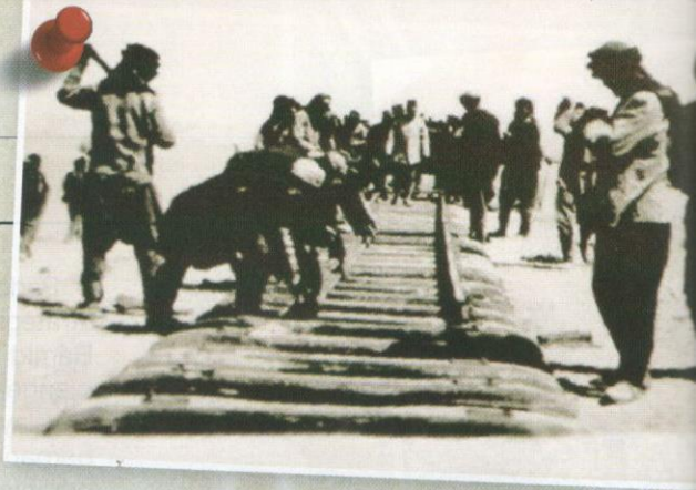
Tentera membina landasan kereta api Hijaz.