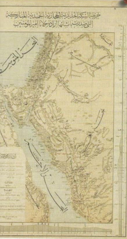
Peta projek kereta api Hijaz yang diterbitkan atas arahan titah diraja ( irade-i Seniyye ) Sultan Abdul Hamid II.

Misalnya, perjalanan dari Damsyik menuju ke Madinah dan Makkah akan mengambil masa selama sebulan lebih dengan menunggang unta. Namun begitu, menerusi jangkaan yang dibuat, projek kereta api Hijaz dapat memendekkan perjalanan tersebut menjadi sekitar tiga hari sahaja.