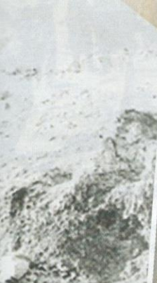
Lokomotif kereta api Hijaz.