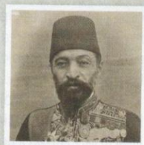
Potret Izzat Pasha al-Abid.

Suez oleh British bagi menghadapi situasi perang. Oleh itu, usaha untuk mengekalkan kawalan terhadap