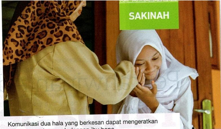
Komunikasi dua hala yang berkesan dapat mengeratkan hubungan antara anak dengan ibu bapa.

Firman Allah SWT yang bermaksud, “Dan derhanakanlah langkahmu semasa berjalan, rendahkanlah suaramu (semasa berkata- ta), sesungguhnya seburuk-buruk suara ialah ara keldai.”(Surah Luqman 31:19).