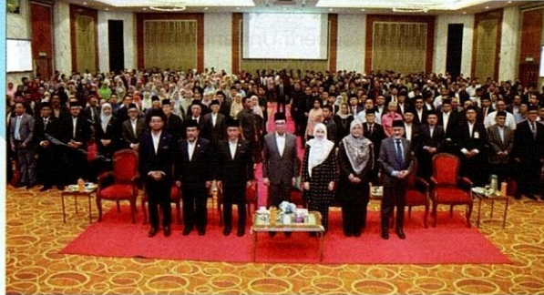
Konvensyen Memartabatkan Perundangan dan Kehakiman Mahkamah Syariah Malaysia membuka ruang perbincangan ke arah memperkasakan sistem perundangan dan kehakiman mahkamah syariah di Malaysia.

Untuk mengetahui bahawa negara kita mempunyai dua sistem kehakiman, iaitu sivil dan syariah. Berdasarkan Perlembagaan Persekutuan, pelantikan hakim mahkamah atasan dan saraan mempunyai undang-undang tersendiri, iaitu Akta Suruhanjaya Pelantikan Kehakiman (Akta 695) dan Saraan Hakim (Akta 45). Namun begitu, hal ini berbeza daripada mahkamah syariah sekarang yang mempunyai undang-undang berkenaan. Hakim sivil terdiri daripada penjawat awam yang menerima gaji berdasarkan sistem gaji perkhidmatan awam, manakala seperti pegawai awam yang lain seperti