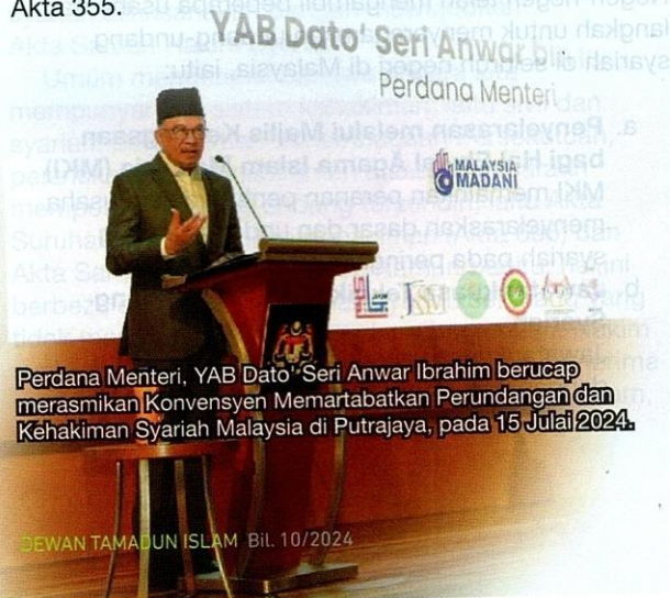
Perdana Menteri, YAB Dato' Seri Anwar Ibrahim berucap merasmikan Konvensyen Memartabatkan Perundangan dan Kehakiman Syariah Malaysia di Putrajaya, pada 15 Julai 2024.

Dalam usaha menangani cabaran semasa, pihak kerajaan pada hari ini telah memberikan komitmen terhadap usaha untuk merealisasikan pindaan Rang Undang-undang (RUU) Akta Mahkamah Syariah (Bidang Kuasa Jenayah) 1965 atau dikenali sebagai Akta 355.