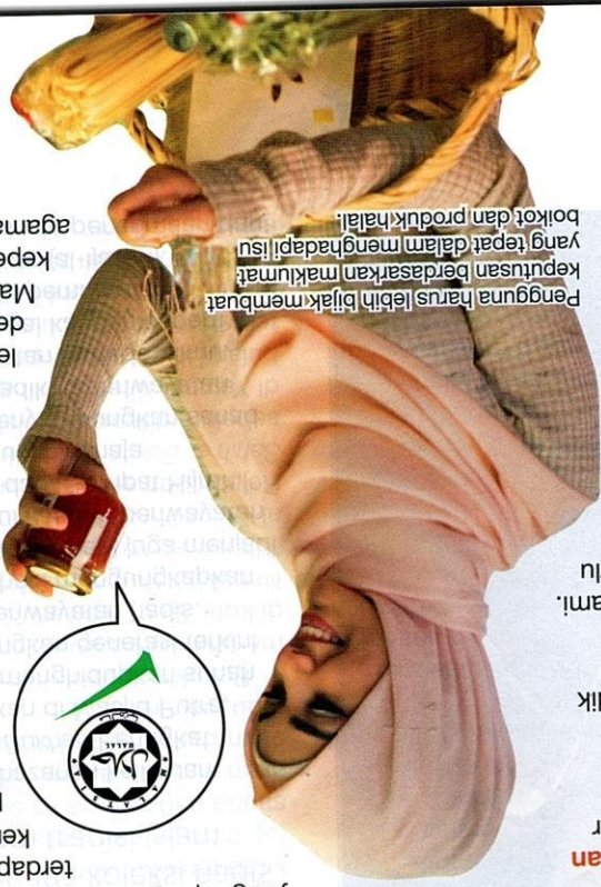
Pengguna harus lebih bijak membuat keputusan berdasarkan maklumat yang tepat dalam menghadapi isu boi kot dan produk halal.

hadapi dilema moral seperti tindakan Islam perlu dilatih untuk membuat ang seimbang antara tuntutan agamaimbangan etika. Sekiranya terdapat ng telah dipersjilkan halal tetapi diboi kot politik atau etika, maka pengguna Muslim pertimbangan alternatif yang lain dan memilih restoran tanpa sijil halal hanya < diboi kot. Oleh hal yang demikian, umat membuat keputusan yang lebih baik dalam kompleks dengan memberikan penekanan insip agama yang kukuh di samping kira isu etika. an dan kesedaran perlu disuburkan secara untuk memastikakan umat Islam tidak n oleh naratif yang mengangap bahawa boleh memilih restoran tanpa sijil halal yang ot. Pengguna Muslim perlu dididik tentang n sijil halal sebagai alat piawataan serta menjaga pemakanan yang suci dan halal. Yang sama, isu etika dan moral seperti cikoit perlu ditangani secara seimbang gabaikan tanggungjawab agama yang lebih gan pendekatan yang menyeluruh, umat it membuat keputusan yang lebih rasional nuhi tuntutan syarat dalam pemilihan erupakan cabaran besar rak berkuasa, ulama rak Islam secara inya. Pihak berkuasa ngkatkan usaha mendidik it tentang kepentingan talal dan menyediakan ang mudah untuk difahami. a yang sama, ulama perlu ktif membincangkan im platform rk meningkatkan secara berterusan. at Islam perlu kan kefahaman erkasakan literasi usnya dalam takanan. Halal bukan etidadaan bahan