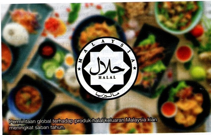
Permintaan global terhadap produk halal keluaran Malaysia kian meningkat saban tahun.

Sesiapa yang menjauhi perkara syubhah bermakna dia telah menyelamatkan agama dan kehormatannya, dan sesiapa yang terjerumus dalam perkara syubhah, maka dibimbangkan akan terjerumus dalam perkara yang haram ....” (Hadis riwayat al-Bukhari dan Muslim).