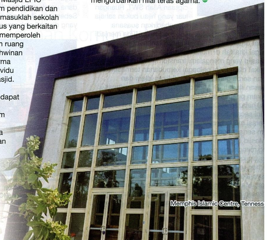
Memphis Islamic Centre, Tennessee

masjid merupakan institusi yang sentiasa relevan dan dinamik dalam konteks masyarakat majmuk di Amerika Syarikat. Peranan sebagai pusat sehenti komuniti bukan sahaja memperkukuh identiti Islam malah menjadikan masjid sebagai platform utama ya dapat membantu umat Islam menyesuaikan diri deng kehidupan dalam persekitaran yang asing tanpa mengorbankan nilai teras agama. 🕌