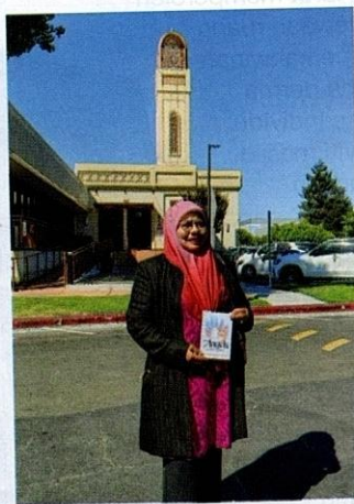
Penulis di hadapan Muslim Community Association (MCA), Santa Clara, California.

Khalayak pembaca pasti tertanya-tanya, bagaimanakah masjid di Amerika Syarikat memperoleh dana untuk melaksanakan pelbagai program? Sebenarnya, terdapat pelbagai kaedah dan langkah yang diambil oleh masjid di negara tersebut untuk