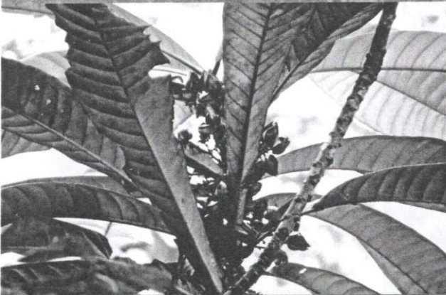
Buah beserta daun Vatica yeechongii .

Hutan Lipur Sungai Tekala terletak di kawasan Hutan Simpan Sungai Lalang, daerah Kajang, Selangor, iaitu 8 km dari bandar Semenyih dan 43 km dari Kuala Lumpur. Luasan kawasan ini melebihi dua setengah ekar. Ada tujuh tingkat air terjun yang mengalir dari puncak hingga ke kawasan rendah di bahagian bawahnya. Hutan Lipur Sungai Tekala diwartakan oleh Kerajaan Selangor sebagai kawasan perlindungan air. Hal ini dilakukan supaya sumber air bersih dapat dimanfaatkan oleh rakyat.