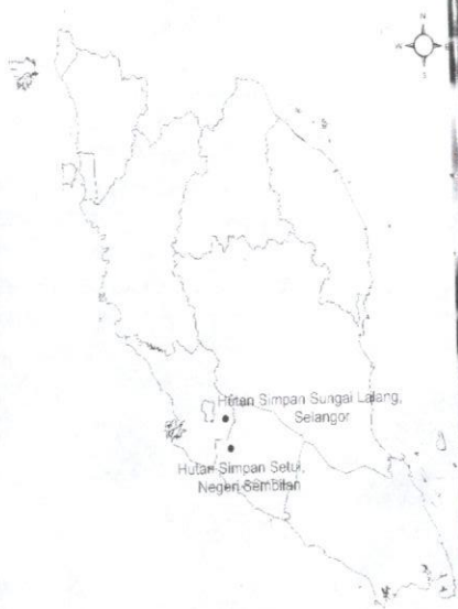
Peta taburan Vatica yeechongii .

Walaupun dari segi fizikalnya spesies Vatica yeechongii tidak mempunyai sebarang nilai ekonomi kerana saiz kayu yang kecil, kehadiran spesies ini memberikan keseimbangan