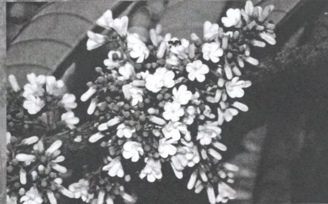
Bunga Vatica yeechongii .

V. yeechongii ialah spesies yang baharu ditemukan dan dinamakan sempena nama orang yang menemukannya, iaitu mendiang Chan Yee Chong. Beliau ialah pembantu penyelidik di Institut Penyelidikan Perhutanan Malaysia (FRIM). Spesies baharu ini ditemukan pada tahun 2002 di kawasan Hutan Lipur Sungai Tekala.