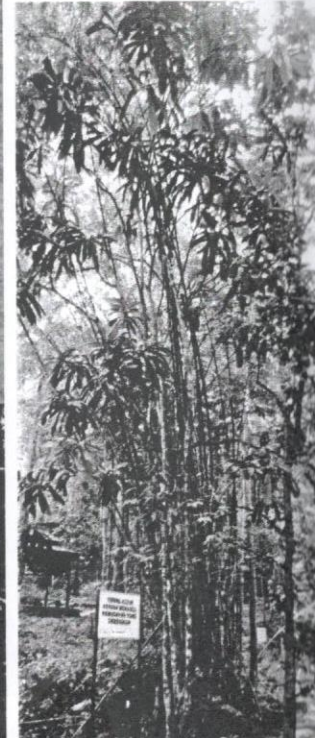
Lokasi Vatica yeechongii berdekatan dengan sungai.

Berdasarkan buku Malaysia Plant Red List-Peninsular Malaysia