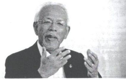
Tan Sri Shahrir Abdul Samad Pengerusi FELDA yang baharu.

Tan Sri Shahrir bukanlah orang baharu dalam FELDA. Beliau pernah berkhidmat dengan FELDA semasa era Tun Abdul Razak, maka bolehlah dikatakan pelantikan beliau sebagai silih pulang ke gagang. Menurut perdana menteri, pelantikan tersebut merupakan penyusunan semula FELDA bagi membolehkan pembahagian tanggungjawab dilakukan