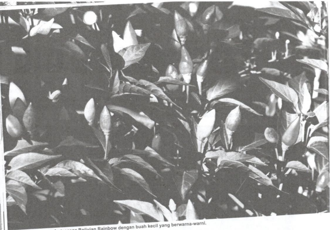
Capsicum frutescens Bolivian Rainbow dengan buah kecil yang berwarna-warni.