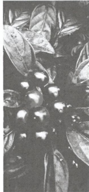
Capsicum annuum Black Pearl, varieti pemenang anugerah. Varieti ini mengeluarkan buah berwarna ungu hitam yang bertukar merah setelah masak.

buah cili mungkin berbeza secara ketara dari segi bentuk, warna dan saiz. Hal ini sering menyebabkan kekeliruan dalam pengelasan dan penamaannya.