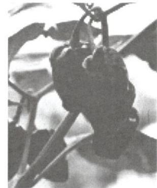
Capsicum chinense Habanero dengan buah berwarna coklat.