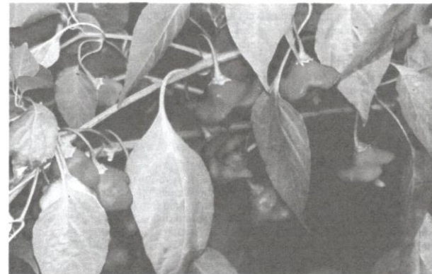
Capsicum baccatum Bishop Cap.

Istilah pubescens yang bermakna berbulu merangkumi cili, seperti Rocoto dan Manzano. Spesies ini berasal dari Bolivia dan kini turut ditanam di Mexico dan Amerika Tengah. Tumbuhan ini bertabiat padat dan boleh membesar hingga 90 cm. Hal ini menyebabkan spesies ini turut dikenali sebagai Tree Chilli. Bunganya berkelopak ungu, manakala buahnya biasanya berbentuk bulat. Bijinya berwarna hitam. Spesies cili ini terencil daripada spesies lain kerana tidak dapat membentuk kacukan silang. Spesies ini juga jarang-jarang ditanam.