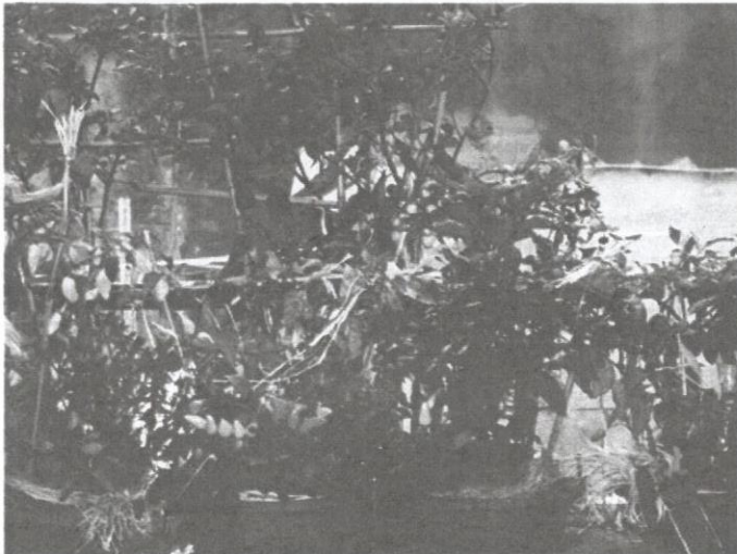
Kepelbagaian buah cili.

Cili ialah tumbuhan renek yang tergolong dalam keluarga Solanaceae. Tomato dan terung pula ialah kerabat dekatnya. Nama cili berasal daripada bahasa Nahuatl menerusi terbitan kata daripada bahasa Sepanyol, iaitu Chile . Nama botani Capsicum pula berasal daripada bahasa Yunani, iaitu kapto , yang bererti menggigit. Tumbuhan ini merangkumi lebih kurang 30 spesies dan melebihi 3000 jenis varieti.