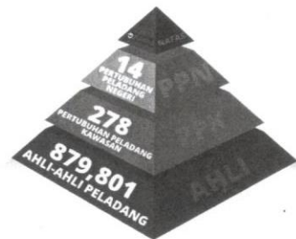
Rajah 1 Jumlah keahlian dan jumlah pertubuhan peladang pada peringkat kawasan dan negeri.

Menyoroti sejarah penubuhan NAFAS, pertubuhan tersebut telah dilancarkan pada 31 Mac 1972 oleh Perdana Menteri Malaysia ke-2, Allahyarham Tun Abdul Razak. Pada peringkat awal penubuhannya, NAFAS yang dikenali sebagai Persatuan Peladang Kebangsaan telah didaftarkan di bawah Akta Persatuan Peladang 1967 dan bertindak sebagai badan induk kepada persatuan-persatuan peladang di seluruh negara. Penubuhan persatuan peladang pada ketika itu