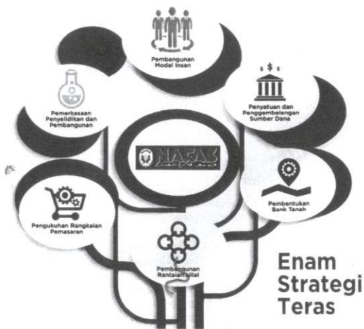
Rajah 2 Pelan Transformasi NAFAS bagi tahun 2012 hingga tahun 2020.

NAFAS telah dilantik sebagai pemegang amanah untuk memasarkan produk terpilih sebagai produk eksklusif PP dengan jenama PELADANG.