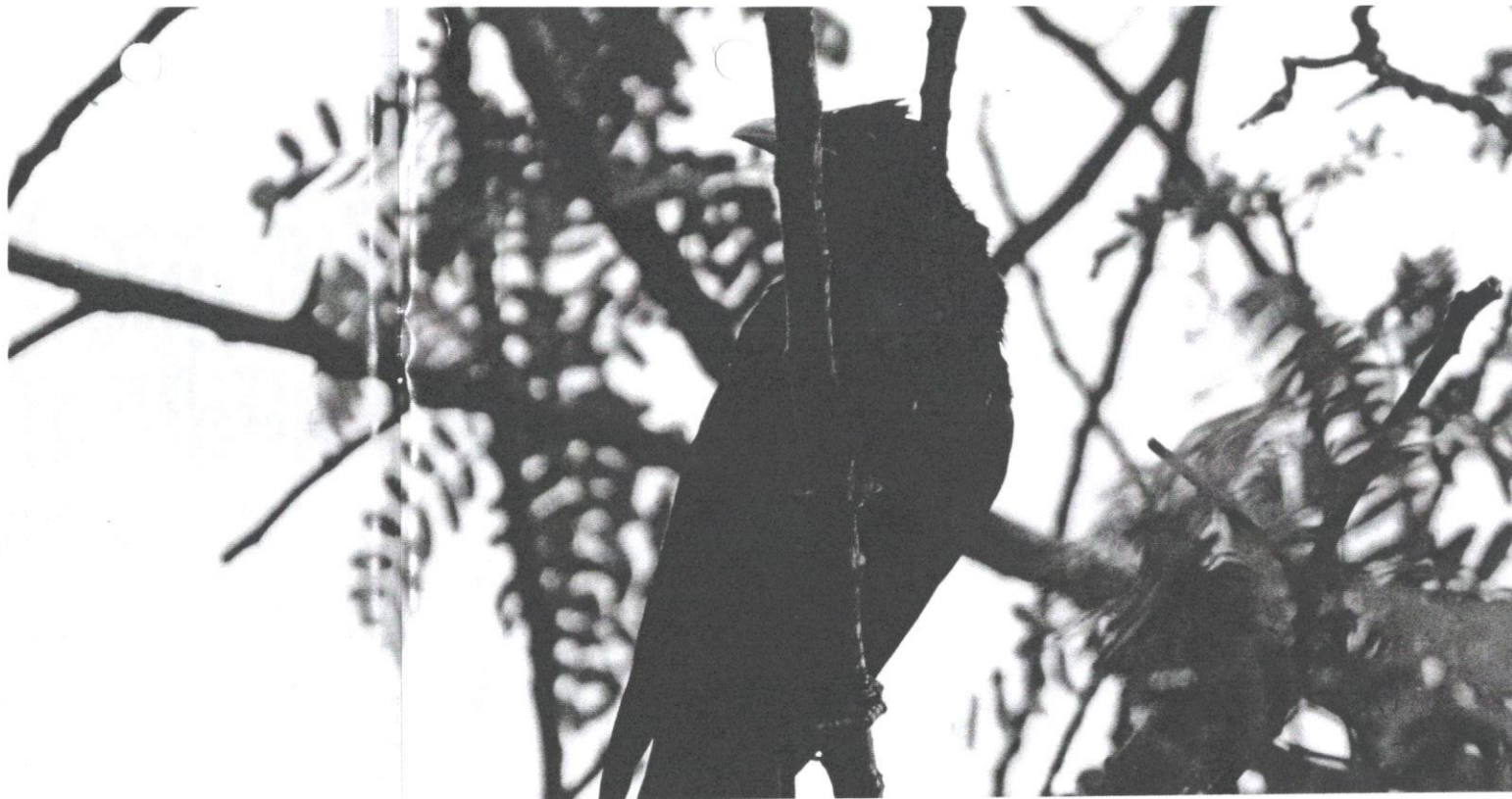
Burung tahu jantan berwarna hitam pekat.

Sarang burung gagak rumah dibina daripada ranting kayu yang disusun rapi. Sebanyak dua biji telur yang berwarna putih dihasilkan oleh burung tahu. Telur ini dieramkan oleh burung tahu betina