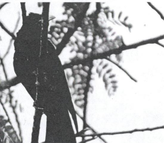
berwarna putih kuning.

lebih kurang tiga minggu sebelum menetas. Anak yang masih kecil dijaga dan diberi makanan oleh ibunya. Dengan cara ini, populasi burung gagak rumah berkurangan.