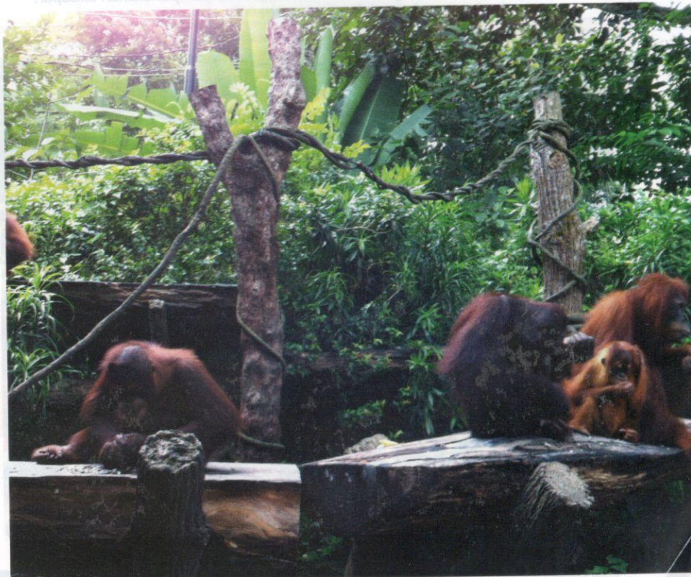
Kawasan pameran yang menyerupai habitat asal haiwan.

Haiwan liar yang berada di dalam ruang pameran kebiasaannya mendepani masalah untuk menyesuaikan diri dengan keadaan ruang yang lebih kecil daripada habitat asal, yang akhirnya menyebabkan