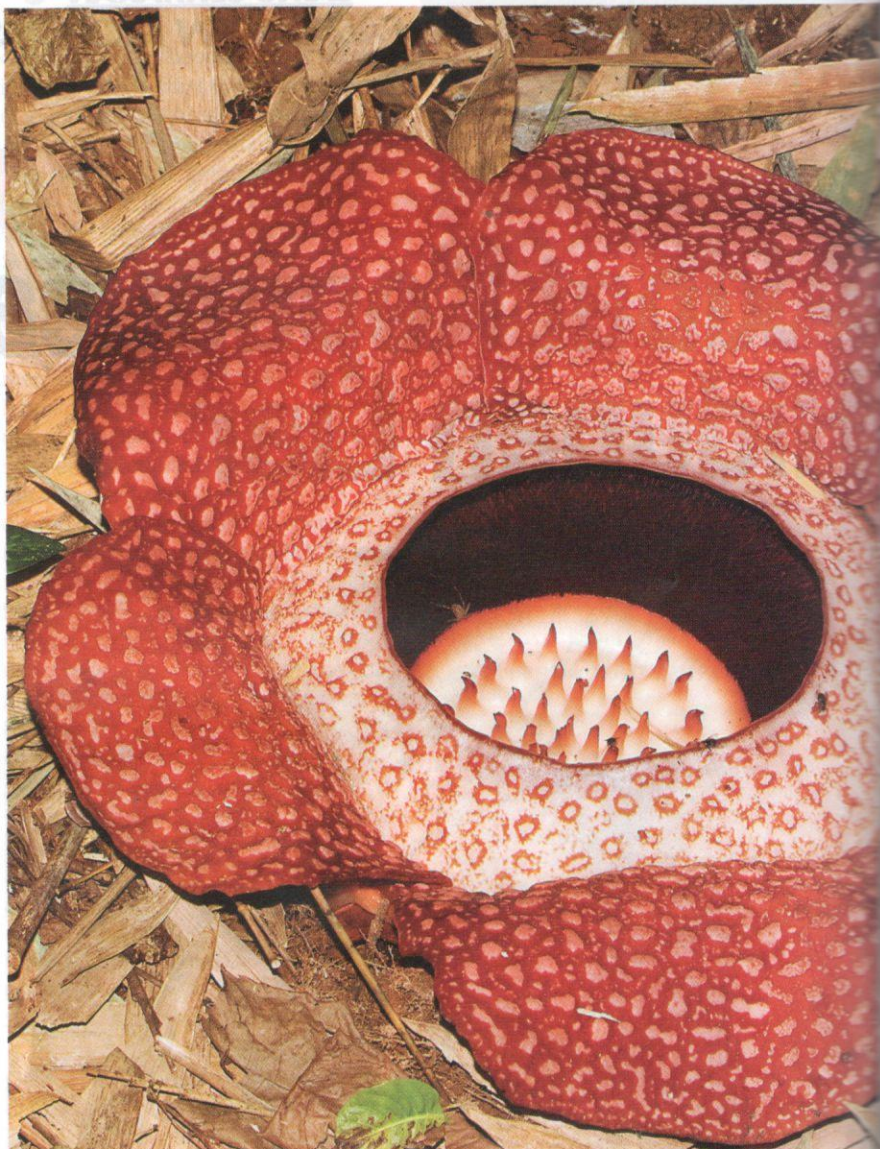
Haiwan dan tumbuhan dalam ekosistem belantara saling bergantung antara satu sama lain untuk melengkap fungsi keupayaan ekologi.

Pemburuan haram ini juga menyaksikan bahawa statistik harimau belang semakin diancam dan terdedah