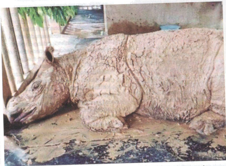
Iman yang disahkan mati selepas menderita disebabkan oleh ketumbuhan pada uterusnya yang dikesan sejak Mac 2014.

Ancaman kepupusan hidupan liar juga dapat dikawal dengan beberapa langkah pemuliharaan, antaranya termasuklah dengan usaha pemeliharaan, pendidikan, penyelidikan dan pembangunan. Pemeliharaan ini merangkumi penanaman semula hutan di kawasan yang ditebang dan