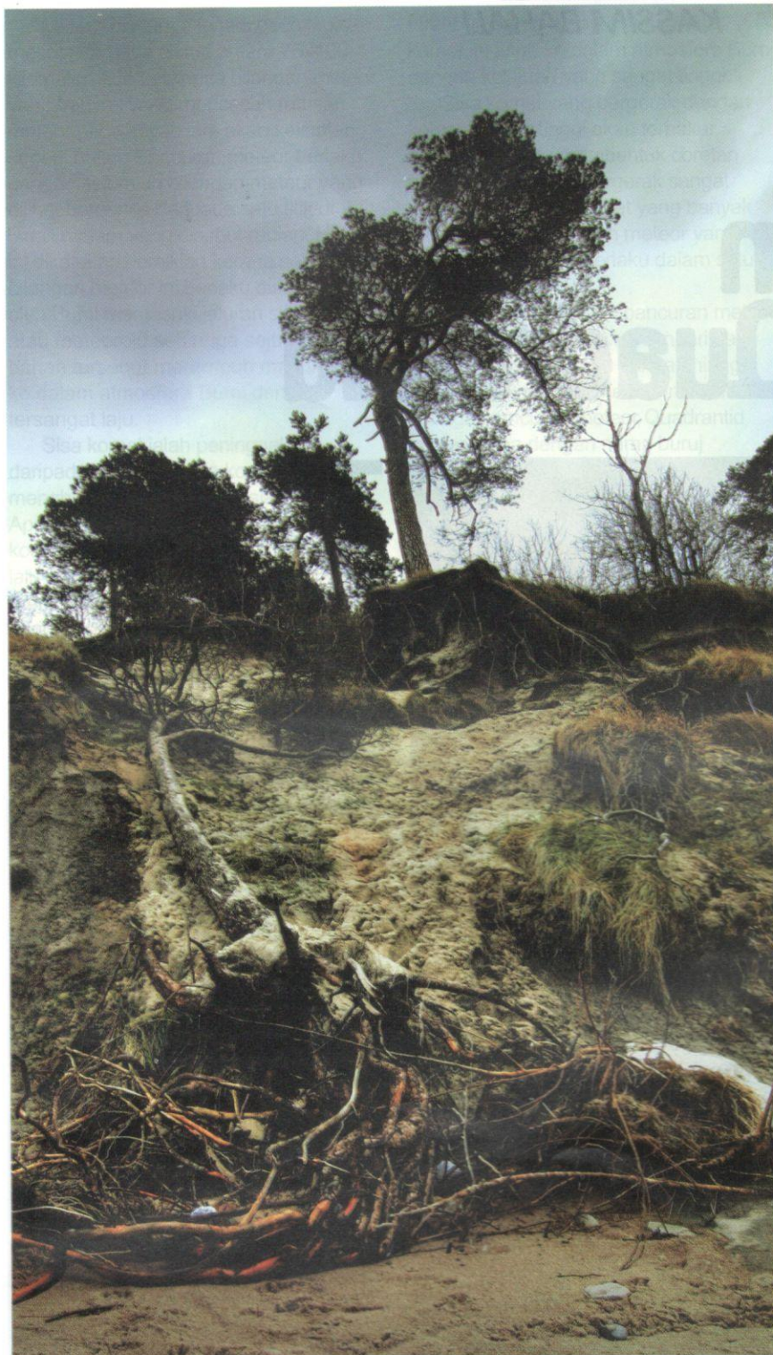
Kemusnahan flora disebabkan oleh kelalaian manusia.

melakukan pembalakan secara terpilih, iaitu aktiviti penebangan hanya melibatkan pokok terpilih dan meninggalkan sejumlah pokok besar dan pokok kecil. Dari sudut pendidikan pula, dengan menekankan kesedaran terhadap usaha membanteras penggunaan barangan yang diperbuat daripada spesies terancam khususnya yang melibatkan barangan kulit haiwan tersebut, harus digiatkan lagi.