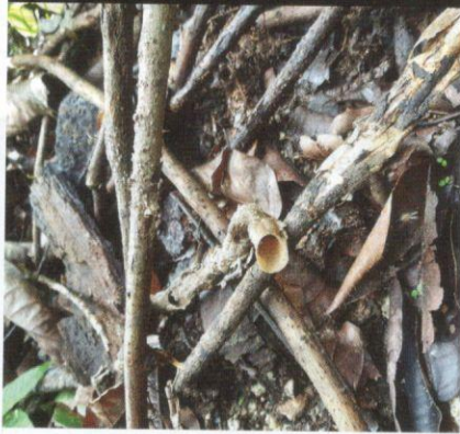
Pelbagai bentuk sarang kelulut boleh dijumpai di hutan Semenanjung Malaysia.

Antara spesies yang sering ditemukan di hutan Semenanjung Malaysia, termasuklah Tetrigona apicalis , Homotrigona fimbriata , Tetragonula melina dan Lepidotrigona terminata . Kelimpahan kelulut didapati berkaitan rapat dengan kesihatan hutan, misalnya