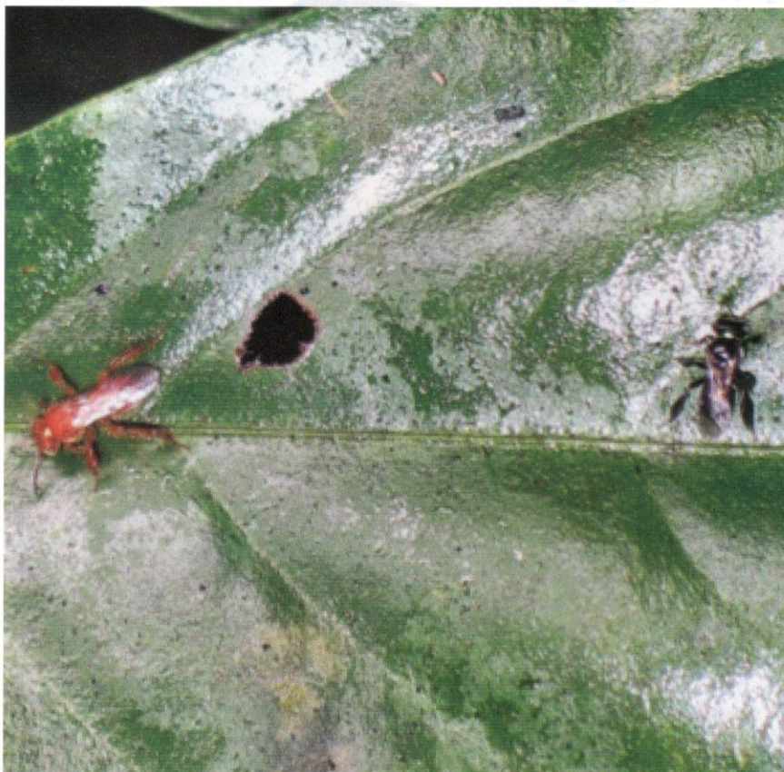
Dua spesies kelulut Tetragona atripes (oren) dan Heterotrigona itama (hitam) yang sedang berehat di atas permukaan daun.

dan semakin banyak pengusaha madu lebah kelulut muncul dari hari ke hari. Kualiti madu juga bergantung pada kepelbagaian sumber makanan (nektar) yang dikutip oleh serangga kecil ini. Namun begitu, permintaan pasaran terhadap madu kelulut liar juga masih tinggi dan dikatakan mempunyai kualiti yang lebih baik, spesies ini masih terus terancam akibat pencarian madu kelulut liar secara leluasa.