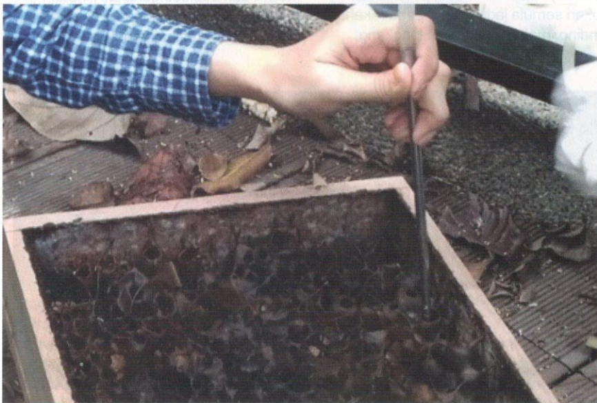
Pengumpulan madu kelulut di ladang kelulut.

Secara amnya, penghasilan madu kelulut secara penternakan memberikan impak yang baik terhadap ekonomi