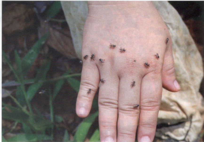
Kumpulan kelulut yang tertarik terhadap kandungan garam pada peluh manusia.

Spesies Heterotrigona itama dan Geniotrigona thoracica ialah kelulut yang popular ditenak di ladang lebah kelulut kerana mudah beradaptasi dengan persekitaran dan menghasilkan madu dengan cepat.