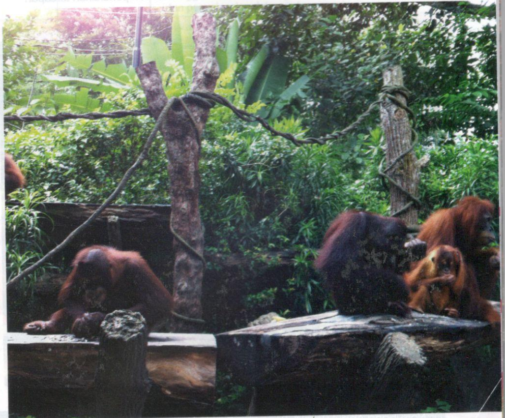
Kawasan pameran yang menyerupai habitat asal haiwan.

Haiwan liar yang berada di dalam ruang pameran kebiasaannya mendepani masalah untuk menyesuaikan diri dengan keadaan ruang yang lebih kecil daripada habitat asal, yang akhirnya menyebabkan