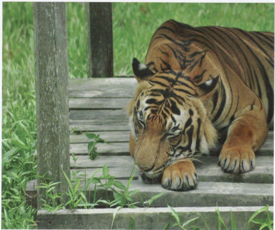
Harimau merupakan kucing paling besar di Malaysia.

di Malaysia hanya tinggal kira-kira 250 hingga 340 individu sahaja. Konflik antara haiwan dengan manusia sering terjadi bagi penduduk yang tinggal berhampiran dengan hutan, dan terserempak dengan harimau. Adakala, penduduk mengambil tindakan untuk membunuh harimau tersebut kerana ketakutan, dan adakala harimau membunuh penduduk kerana berasa terancam. Malaysia dijangkakan akan kehilangan pak belang ini buat selamanya dalam jangka masa lima hingga 10 tahun sekiranya tiada langkah drastik diambil.