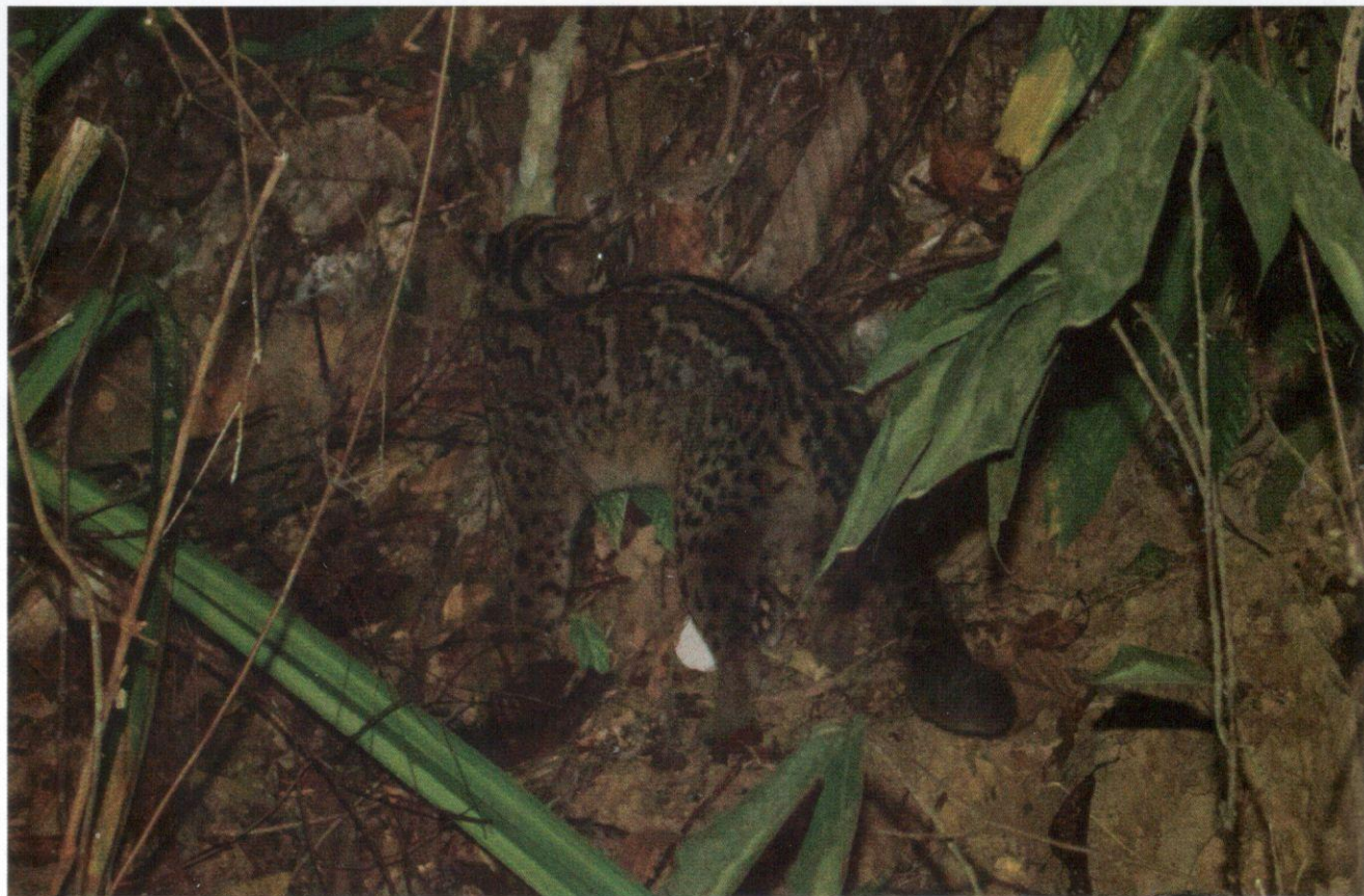
Pardofelis marmorata merupakan kucing pemanjat pohon yang handal.

Kucing Batu ( Pardofelis marmorata ) merupakan kucing pemanjat pohon yang handal dan memiliki ekor yang panjang serta bulu yang sangat tebal. Ukuran dan bentuk ekor ini berfungsi dalam menjamin keseimbangan ketika bergerak di atas dahan atau ranting pohon. Selain itu, kedua-dua pasang kakinya besar dan kukuh. Makanan utama Kucing Batu adalah berbagai-bagai jenis burung, tupai, tikus, dan reptilia. Lantaran bulunya yang sangat tebal, spesies kucing liar ini banyak yang diburu untuk tujuan hiasan.