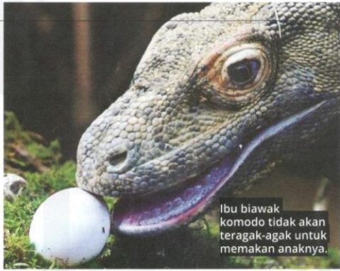
Ibu biawak komodo tidak akan teragak-agak untuk memakan anaknya.