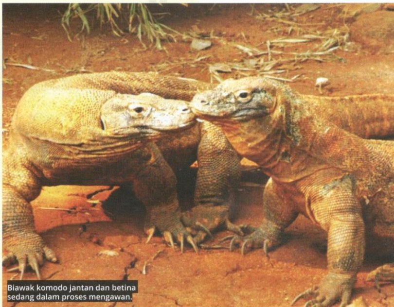
Biawak komodo jantan dan betina sedang dalam proses mengawan.

Kebanyakan zoo cuma menyimpan biawak komodo betina dan hanya sekali-sekala membawa biawak komodo jantan untuk proses mengawan. Saintis menggalakkan pihak pengurusan zoo untuk menyimpan kedua-dua spesies; jantan dan betina bersama-sama untuk mengelakkan proses partenogenesis, serta mengekalkan cara hidup mereka seperti di habitat semula jadi. 📌