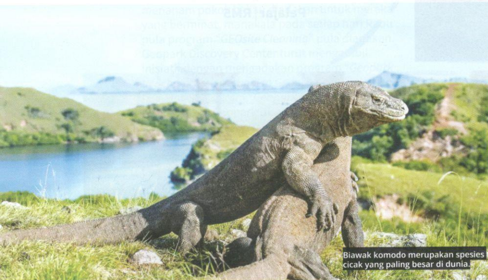
Biawak komodo merupakan spesies cicak yang paling besar di dunia.

B IAWAK komodo, atau nama saintifiknya, Varanus komodoensis ialah spesies cicak yang paling besar di dunia. Biawak ini banyak ditemui di Pulau Komodo di Nusa Tenggara Timur dan mampu membesar hingga berkepanjangan tiga meter (10 kaki) dan mencapai berat hingga 166 kilogram. Secara purata, cicak gergasi ini bersaiz sekitar 1.8 meter (enam kaki) untuk spesies betina dan 2.7 meter (sembilan kaki) untuk spesies jantan. Ukuran besar biawak komodo disebabkan kelebihanannya menjadi pemangsa di sekitar pulau yang didiami tanpa saingan.