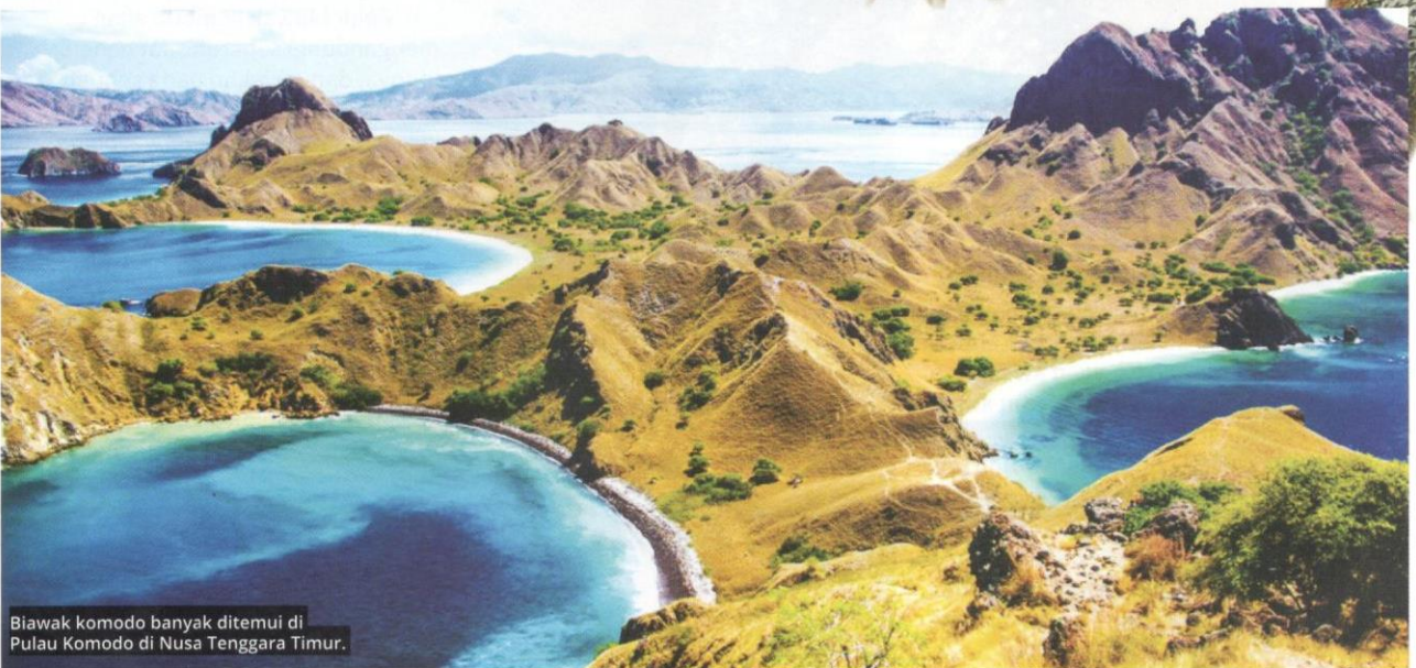
Biawak komodo banyak ditemui di Pulau Komodo di Nusa Tenggara Timur.

Penglihatan dan deria bau biawak komodo agak lemah tetapi lidahnya yang berpecah dan bercabang dapat menjejaki mangsa sejauh sembilan kilometer.