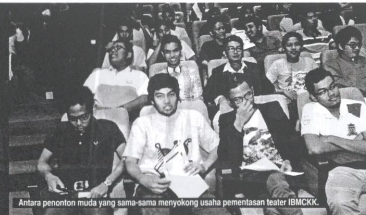
Antara penonton muda yang sama-sama menyokong usaha pementasan teater IBMCKK.

Sebagai permulaan gerakan menimbulkan minat dan menjiwai seni persembahan teater itu, penulis memberikan kredit kepada semua tenaga produksi kerana nampak bersungguh-sungguh untuk menjayakan persembahan itu. Yang lebih mengagumkan penulis, setiap tenaga produksi juga terlibat dalam lakonan dan menyambut