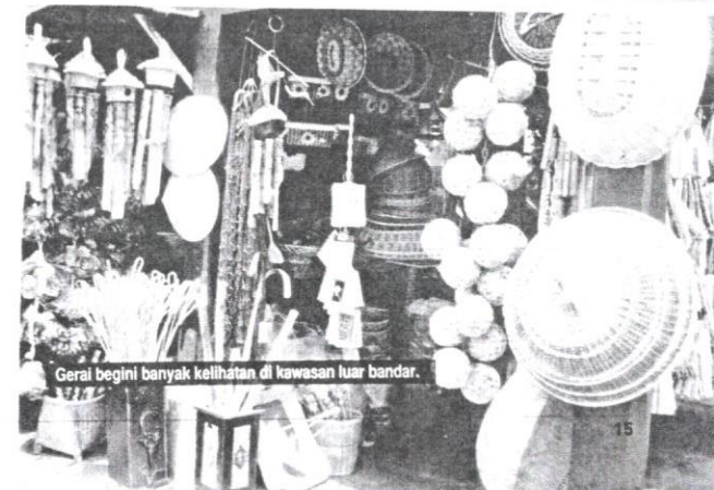
Geral begini banyak kelihatan di kawasan luar bandar.

Oleh itu, pihak berkuasa perlulah memandang isu ini dengan lebih serius. Pembalakan haram dan penebangan pokok secara sesuka hati perlulah dibanjaras bagi mengelakkan kepupusan habitat semula jadi flora. Kepentingan pokok dan tumbuh-tumbuhan perlulah sentiasa diingatkan dalam kalangan penduduk tempatan. Penghasilan produk kraf akan meningkat sekiranya bahan