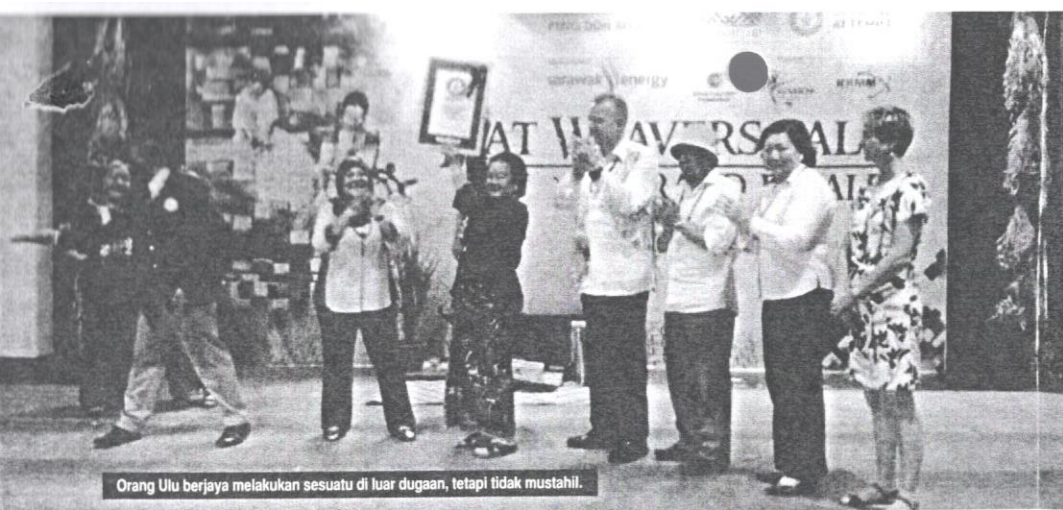
Orang Ulu berjaya melakukan sesuatu di luar dugaan, tetapi tidak mustahil.

bukan sahaja perlu bermutu tinggi, tetapi juga unik, termasuk dari segi motif dan reka bentuknya. Dengan kepelbagaian etnik dan budaya di negara ini, setiap kraf tangan etnik terbahit mencerminkan budaya etnik itu. Kraf tangan di negara ini mempunyai mutu dan nilai yang tinggi, serta mampu menarik minat orang luar membelinya. Kepelbagaian etnik, budaya, dan agama memperkaya khazanah kraf tangan. Dengan lebih daripada 80 etnik di negara ini, sudah tentu kraf tangan yang dihasilkan oleh mereka juga beraneka dan berwarna-warni, apatah lagi produk itu menggunakan sumber dan bahan semula jadi di negara ini. Produk yang dihasilkan merupakan sentuhan unik tukang terbahit.