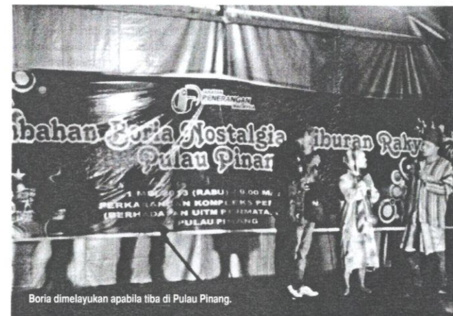
Boria dimelayakan apabila tiba di Pulau Pinang.

Boria mempunyai pengisian dua segmen, iaitu bahagian pengenalan yang dimulakan dengan lakonan sketsa yang mempunyai mesej, nasihat