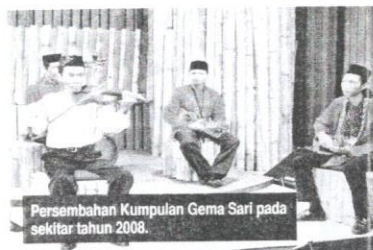
Persembahkan Kumpulan Gema Sari pada sekitar tahun 2008.