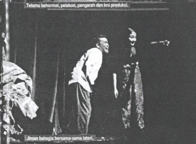
Jiman bahagia bersama-sama isteri.

Malaysia, komunisme tersebar ke seluruh Rusia pada tahun 1917 selepas kejayaan revolusi Rusia menggulingkan kerajaan Tsar Nicholas II.