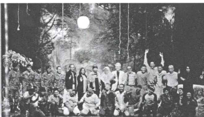
Tetamu kehormat, pelakon, pengarah dan kru produksi.