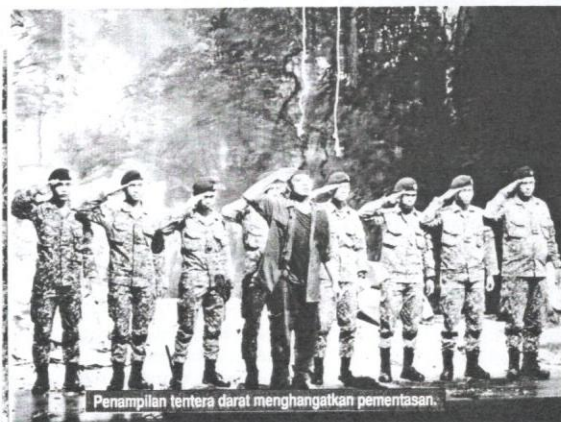
Penampilan tentera darat menghagatkan pementasan.

oleh Komander Marwan, anggota PKM berbangsa Melayu. Jiman memaki hamun Marwan kerana berendam atas kematian ahli keluarganya. Marwan menembak tepat dada kiri Jiman dan memukul Roslan yang menghina fahaman komunis. Roslan menghentak kepala Marwan dengan menggunakan pistol sehingga penganas itu pingsan. Setelah Marwan sedar, Roslan menghujahkan keburukan fahaman komunis, menyebabkan Marwan marah kerana gagal mematahkan setiap hujah Roslan tentang komunisme.