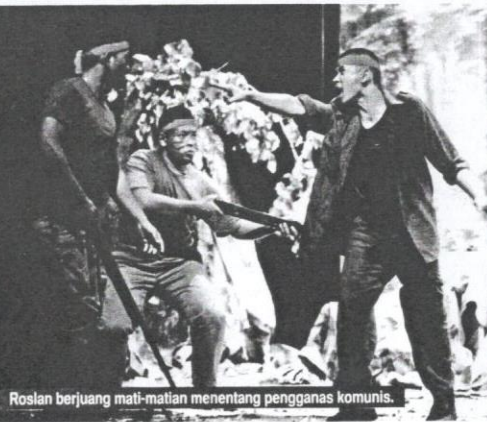
Roslan berjuang mati-matian menentang penganas komunis.