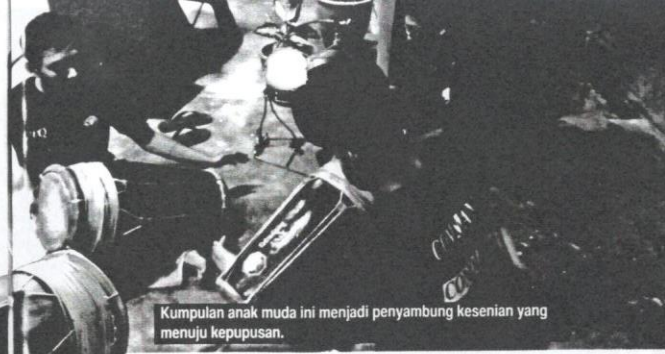
Kumpulan anak muda ini menjadi penyambung kesenian yang menuju kepupusan.

tiga kali, tiga hari. Kemudian berarak perahu dan (di) darat, tiadalah dapat diperikan besar arakannya. Mula-mula berlepas, dilumbakan orang sekalian perahu; berdayung sama berdayung, berkayuh sama-sama berkayuh; bertaruhkan ringgit beribu-ribu sekalian datuk-datuk. Kemudian baharulah berarak betul, diambil menora, makyung bawa berarak ke dalam perahu, dengan gong gendangnya, meriam dan lela, senapang pada sekalian perahu dimasukkan. Maka bunyinya mengarus awan dan demikianlah bunyi manusia di sungai dan (di) darat, tiadalah apalagi kedengaran dengan sorak tempik bunyinya.