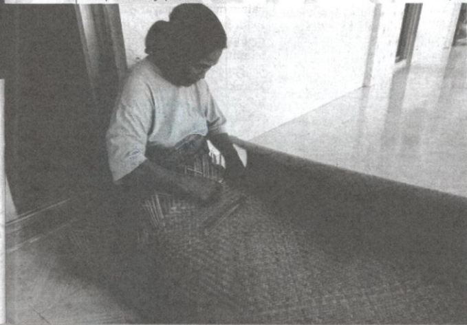
Perempuan Iban menganyam tikai bemban.

Tikai lampit, atau lebih dikenali sebagai tikar rotan, merupakan sejenis tikai yang terdapat dalam anyaman kraf tangan masyarakat Iban. Dalam konteks ini, proses pembuatan tikai lampit jauh lebih rumit daripada pembuatan tikar bemban kerana kesukaran untuk mencari rotan sebagai asas binaan anyaman. Kesukaran itu menjadikan harga tikai lampit ini agak mahal. Pembuatan tikai lampit sebenarnya dimulakan oleh masyarakat Kenyah dan Kelabit di Kalimantan, seiring dengan percampuran masyarakat majmuk. Masyarakat Iban mempelajari cara untuk menganyam kraf tangan ini daripada mereka dan membawa