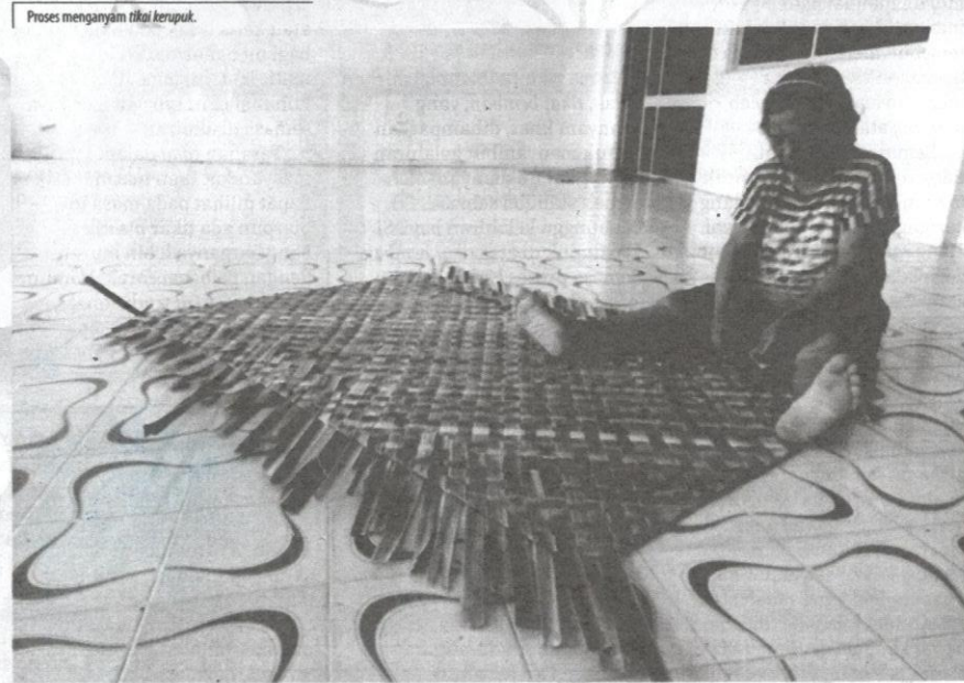
Proses menganyam tikai kerupuk.

Tikai , selain sebagai alas duduk, turut digunakan sebagai petanda bermula dan berakhirnya Pesta Gawai. Pesta Gawai selalunya disambut oleh masyarakat Iban