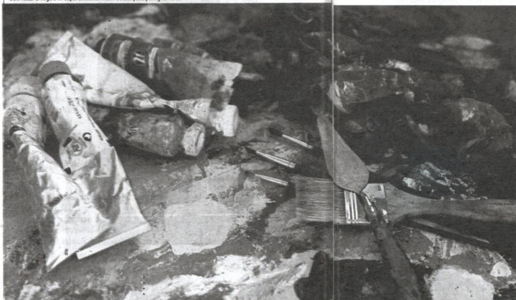
Seni visual di negara ini dapat dikatakan masih berada pada peringkat tunas.

Pelukis separuh masa bermaksud pelukis yang mempunyai pekerjaan hakiki pada waktu siang, namun menghasilkan karya pada waktu malam atau terluang. Di Malaysia, kebanyakan daripada mereka terlibat dalam pendidikan. Mereka menjadi pensyarah seni, kurator dan guru, atau terlibat sebagai pengaruh artistik, pereka prop teater, drama atau filem, dan pereka grafik. Biasanya habuan kewangan daripada pekerjaan harian bukan sahaja untuk memenuhi kehidupan