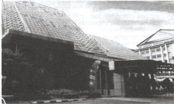
Balai Seni Negara sudah 60 tahun bergelulang dengan seni.

Kewujudan muzium seni kontemporari di negara membangun dan negara maju kini bukan untuk menyaingi kewujudan muzium seni di negara berkecayaan. Muzium seni kontemporari, seperti Museum of Contemporary Art Los Angeles (MoCA LA), Museum of Contemporary Art Shanghai (MoCA Shanghai), Hamburger Bahnhof Museum für Gegenwartdi Berlin dan Museum of Modern and Contemporary Art in Nusantara (MACAN), misalnya, bertujuan untuk mempamerkan karya seni kontemporari yang