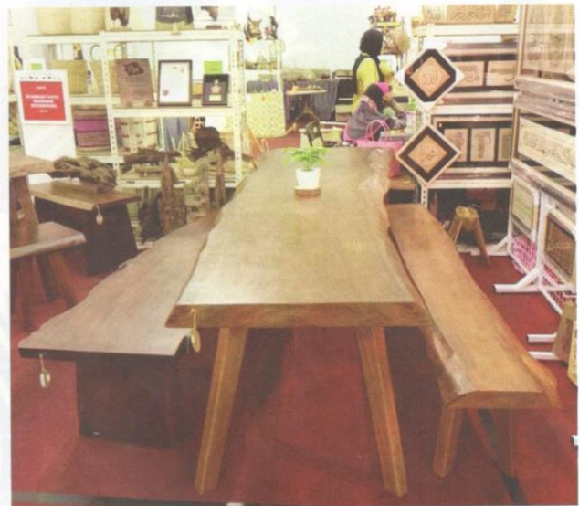
Penghasilan perabot menggunakan kayu yang berkualiti.

Bukan sekadar mempamerkan produk masing-masing tetapi terdapat juga beberapa gerai mengadakan demonstrasi pembuatan barangan kraf tradisi yang menunjukkan kemahiran pembuatnya terutama berkaitan dengan ukiran kayu, menganyam tikar mengkuang, membuat bakul rotan dan mencetak batik. Beberapa orang daripada mereka merupakan tukang mahir yang diiktiraf dan dilantik oleh Kraftangan Malaysia sebagai Adiguru Kraf yang mula diperkenalkan pada 1987.