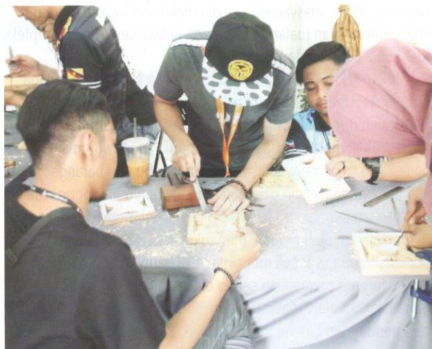
Aktiviti pembuatan kraf pada Hari Kraf Kebangsaan 2020.

Menyorot catatan sejarah, minat untuk mengumpulkan barang-barang dan peralatan lama yang digunakan oleh masyarakat ini yang dilihat sebagai unik dan menarik telah dimulakan oleh beberapa orang pentadbir British di Tanah Melayu seawal era 1950-an yang turut mendorong Persatuan Pertanian dan Pekebunan Malaya (MAHA) menjadikan kraf antara bahan pamerannya pada era tahun 1960-an dan 1970-an yang berlanjutan hingga kini.