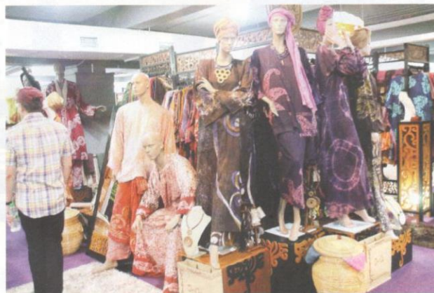
Hasil kraf daripada tekstil.

Usaha khusus memajukan produk kraftangan ini kemudiannya dipertanggungjawabkan kepada Lembaga Kraftangan Malaysia yang ditubuhkan pada 1973 yang kemudiannya menjadi Perbadanan Kemajuan Kraftangan