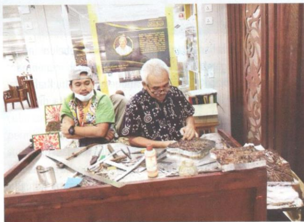
Adiguru Kraf batik menunjukkan demonstrasi membuat batik.

Di samping pameran kekal sedia ada di Kompleks Kraf Kuala Lumpur yang memaparkan pelbagai maklumat mengenai industri kraf, penyediaan ruang pameran tambahan di dalam dan luar kompleks juga turut memberikan kesempatan kepada 680 orang usahawan kraf dari seluruh negara mempamerkan aktiviti pengeluaran kraf masing-masing. Ini jelas menampakkan wujudnya kepelbagaian jenis kraf hasil kreativiti masyarakat Malaysia pelbagai kaum yang turut disifatkan oleh pengunjung terutama pelancong asing sebagai sesuatu yang unik dan menarik.