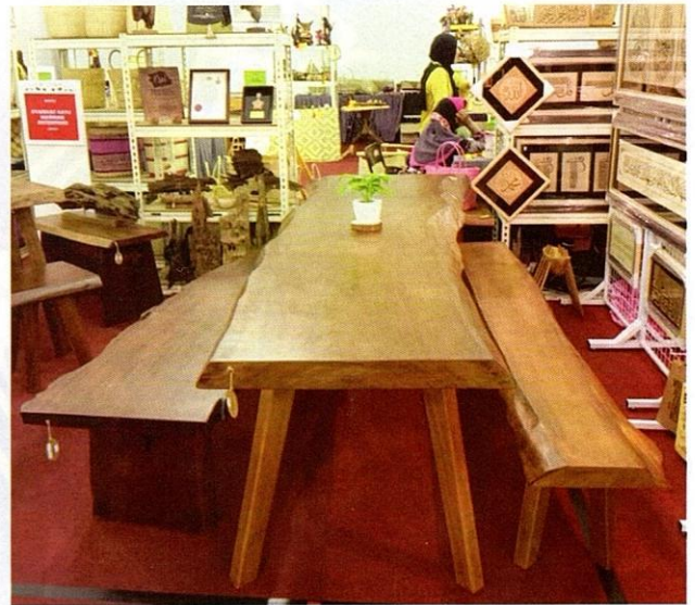
Penghasilan perabot menggunakan kayu yang berkualiti.

Bukan sekadar mempamerkan produk masing-masing tetapi terdapat juga beberapa gerai mengadakan demonstrasi pembuatan barangan kraf tradisi yang menunjukkan kemahiran pembuatnya terutama berkaitan dengan ukiran kayu, menganyam tikar mengkuang, membuat bakul rotan dan mencetak batik. Beberapa orang daripada mereka merupakan tukang mahir yang diiktiraf dan dilantik oleh Kraftangan Malaysia sebagai Adiguru Kraf yang mula diperkenalkan pada 1987.