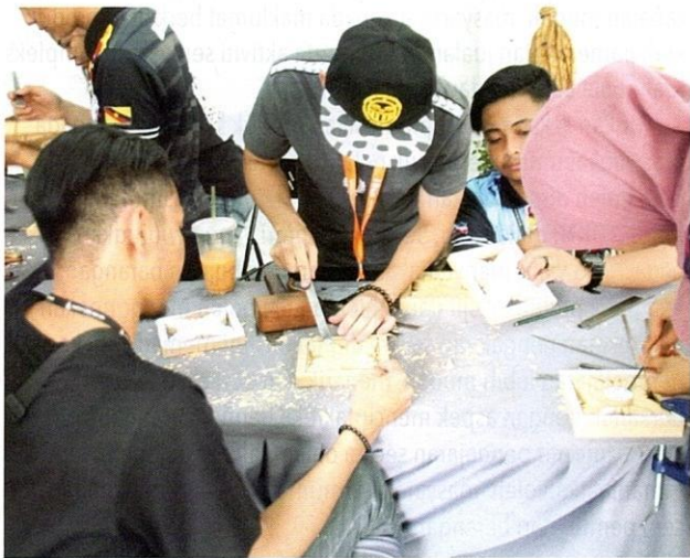
Aktiviti pembuatan kraf pada Hari Kraf Kebangsaan 2020.

Menyorot catatan sejarah, minat untuk mengumpulkan barang-barang dan peralatan lama yang digunakan oleh masyarakat ini yang dilihat sebagai unik dan menarik telah dimulakan oleh beberapa orang pentadbir British di Tanah Melayu seawal era 1950-an yang turut mendorong Persatuan Pertanian dan Pekebunan Malaya (MAHA) menjadikan kraf antara bahan pamerannya pada era tahun 1960-an dan 1970-an yang berlanjutan hingga kini.