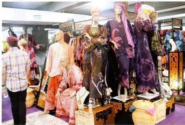
Hasil kraf daripada tekstil.

Usaha khusus memajukan produk kraftangan ini kemudiannya dipertanggungjawabkan kepada Lembaga Kraftangan Malaysia yang ditubuhkan pada 1973 yang kemudiannya menjadi Perbadanan Kemajuan Kraftangan