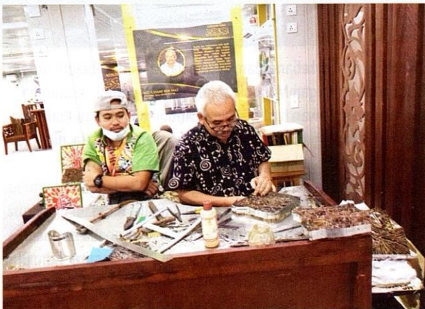
Adiguru Kraf batik menunjukkan demonstrasi membuat batik.

Di samping pameran kekal sedia ada di Kompleks Kraf Kuala Lumpur yang memaparkan pelbagai maklumat mengenai industri kraf, penyediaan ruang pameran tambahan di dalam dan luar kompleks juga turut memberikan kesempatan kepada 680 orang usahawan kraf dari seluruh negara mempamerkan aktiviti pengeluaran kraf masing-masing. Ini jelas menampakkan wujudnya kepelbagaian jenis kraf hasil kreativiti masyarakat Malaysia pelbagai kaum yang turut disifatkan oleh pengunjung terutama pelancong asing sebagai sesuatu yang unik dan menarik.