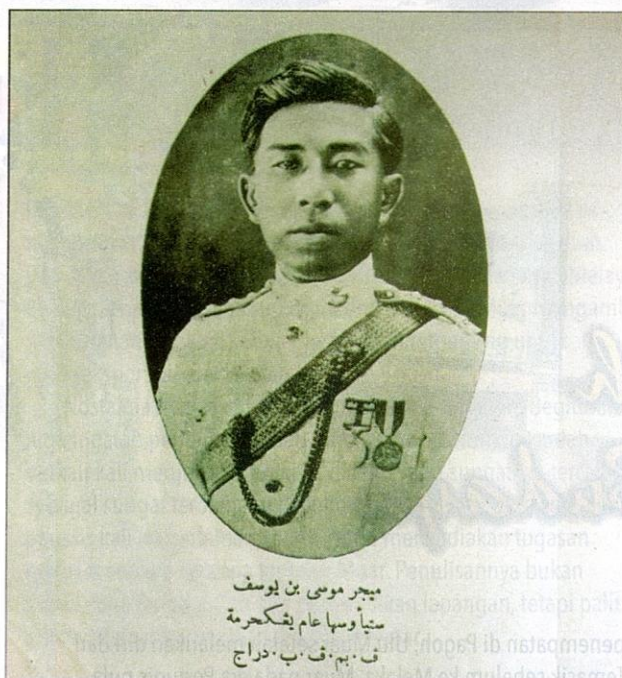
Pak Lomak merupakan "Bapa Ghazal Melayu Johor".

Teknik permainan gambus yang menghasilkan bunyi getar/tremolo dengan menggunakan alat pemetik tersendiri.