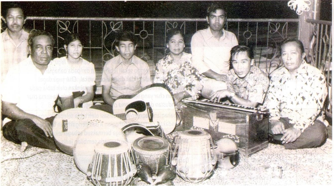
Kumpulan Seri Melati Ghazal Johor Bahru yang terkenal di Johor sekitar tahun 1970-an.