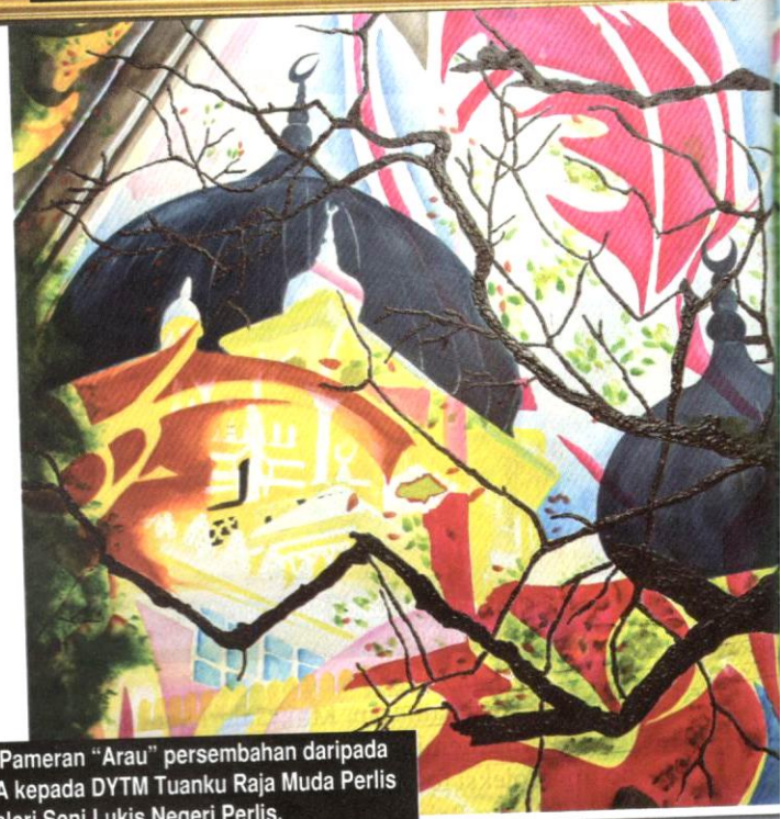
Lukisan Pameran "Arau" persembahan daripada ASWARA kepada DTYM Tuanku Raja Muda Perlis untuk Galeri Seni Lukis Negeri Perlis.