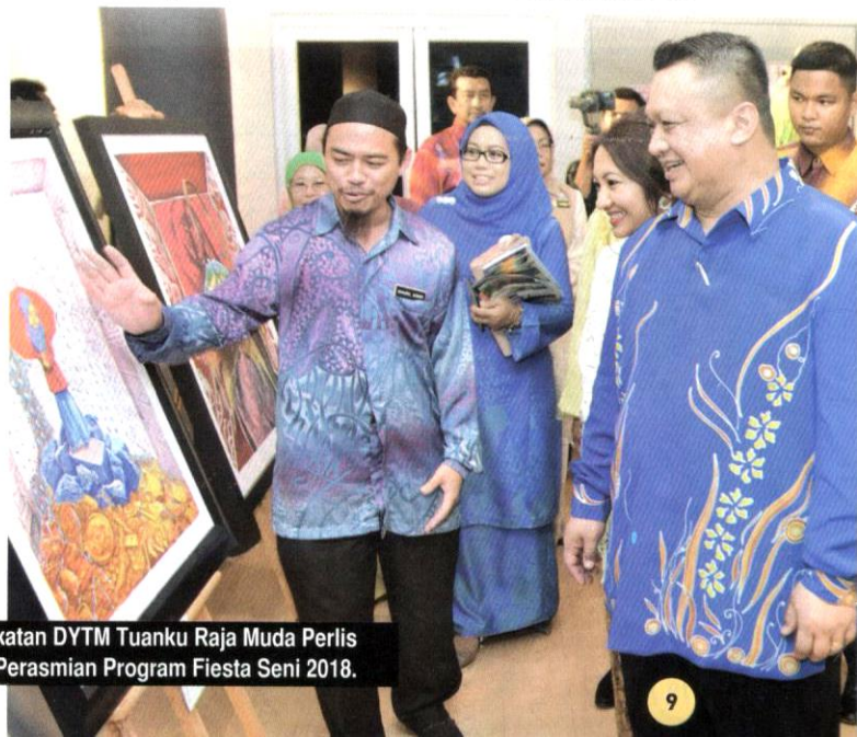
Keberangkatan DYTM Tuanku Raja Muda Perlis sempena Perasmian Program Fiesta Seni 2018.

Terkini, pada bulan Disember 2020, Galeri Seni Lukis Negeri Perlis mengadakan pertandingan Digital Painting menggunakan aplikasi dalam telefon dan hasil daripada pertandingan ini akan dicetak dan dipamerkan di galeri. Hal ini merupakan sebahagian daripada usaha yang dilakukan oleh Perpustakaan Awam Negeri Perlis untuk menambah koleksi lukisan