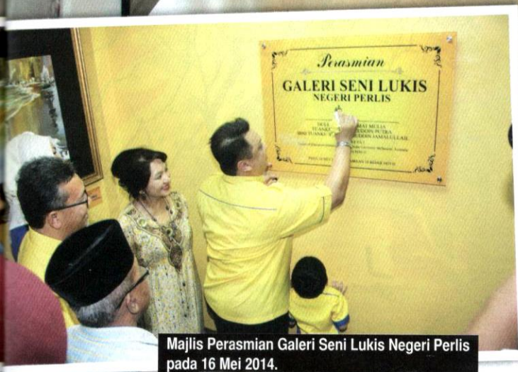
Majlis Perasmian Galeri Seni Lukis Negeri Perlis pada 16 Mei 2014.