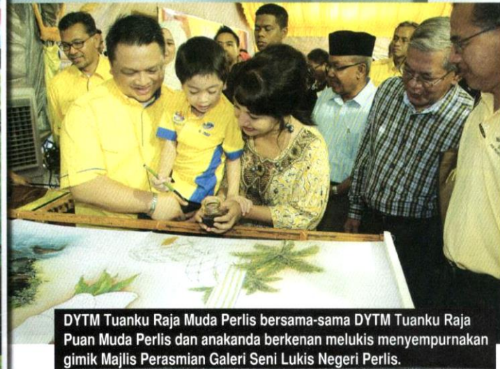
DYTM Tuanku Raja Muda Perlis bersama-sama DYTMs Tuanku Raja Puan Muda Perlis dan anakanda berkenan melukis menyempurnakan gimik Majlis Perasmian Galeri Seni Lukis Negeri Perlis.

pandemik COVID-19. Hingga bulan September 2020, Galeri Seni Lukis Negeri Perlis hanya menerima 807 pengunjung sahaja berbanding dengan tahun sebelumnya. Walau bagaimanapun, pengunjung galeri ini secara dalam talian mencecah 10 000 orang sejak Januari 2020. Hal ini menunjukkan bahawa aktiviti kesenian di negeri ini tidak terhenti, walaupun mengalami kekangan akibat COVID-19.