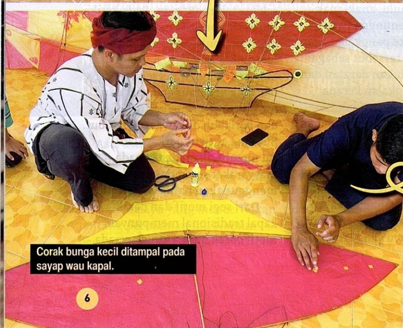
Corak bunga kecil ditampal pada sayap wau kapal.