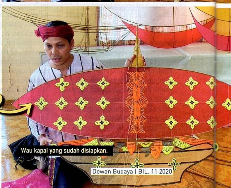
Wau kapal yang sudah disiapkan.