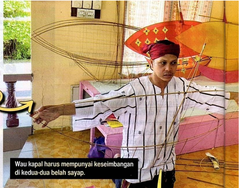
Wau kapal harus mempunyai keseimbangan di kedua-dua belah sayap.