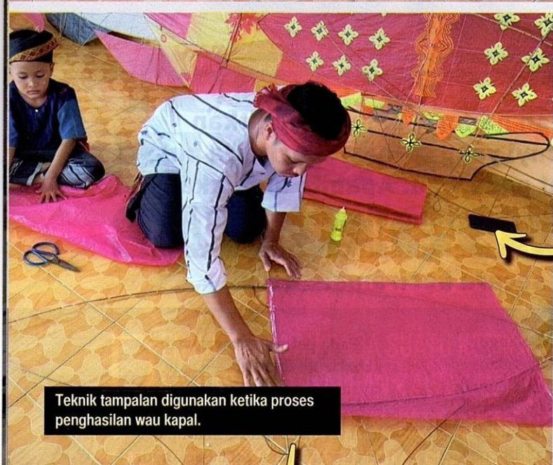
Teknik tampalan digunakan ketika proses penghasilan wau kapal.