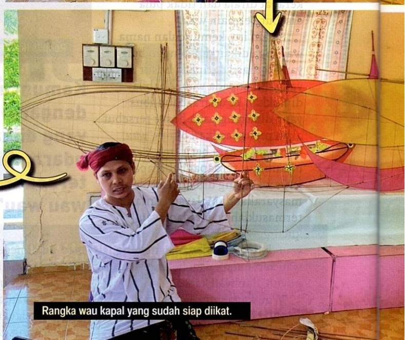
Rangka wau kapal yang sudah siap diikat.