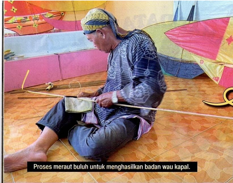
Proses meraut buluh untuk menghasilkan badan wau kapal.