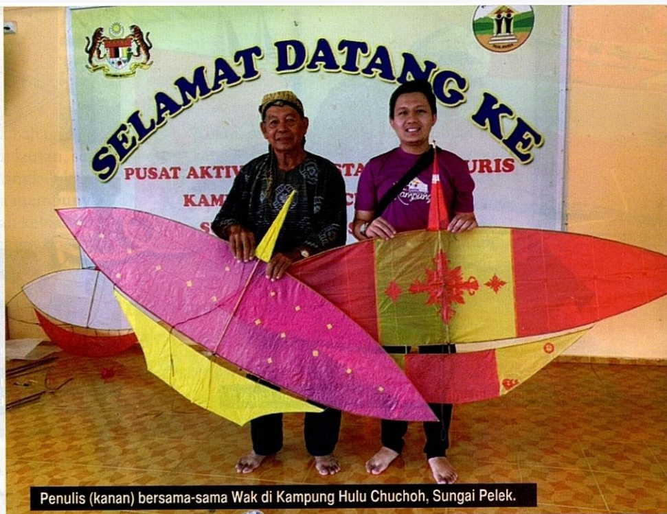
Penulis (kanan) bersama-sama Wak di Kampung Hulu Chuchoh, Sungai Pelek.

Wau kapal dikatakan mulai popular dimainkan sejak tahun