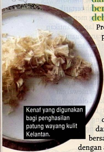
Kenaf yang digunakan bagi penghasilan patung wayang kulit Kelantan.

Proses penghasilan kertas ini melibatkan debu kenaf yang dicampurkan dengan air. Seterusnya, debu kenaf diadunkan dan dilarutkan bersama-sama dengan asid dan kanji. Hal ini bertujuan untuk menjadikan gabungan kenaf dan kanji sebatu bagi tujuan proses pengeringan kelak. Pada masa yang sama, penggiat perlu menghasilkan bingkai bersaiz dua kaki.