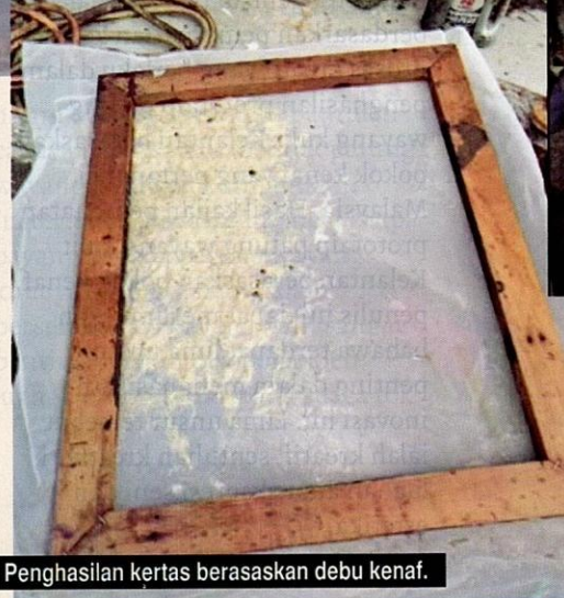
Penghasilan kertas berasaskan debu kenaf.

Sebatian kenaf yang telah kering akan diasingkan, dan seterusnya dipisahkan daripada bingkai serta penapis.