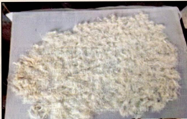
Proses pemisahan sebatian kenaf.