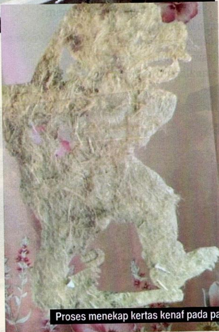
Proses menangkap kertas kenaf pada patung wayang kulit.