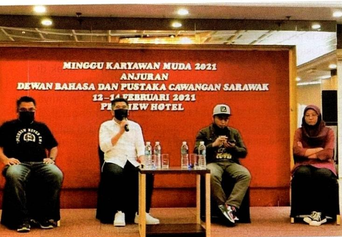
▲ Shield Sahran antara ahli panel semasa berlangsungnya program Minggu Karyawan Muda 2021, anjuran DBPCS.