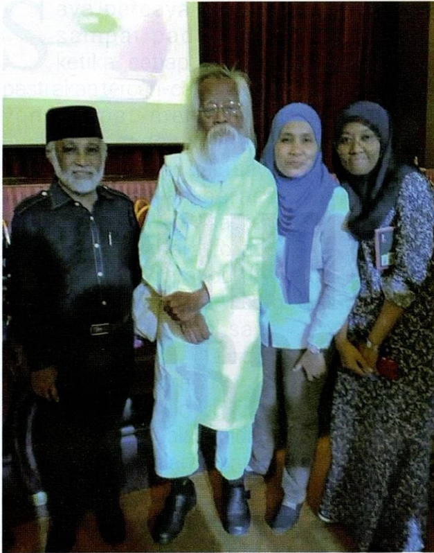
▲ Bergambar kenangan bersama-sama Sasterawan Negara A. Samad Said.