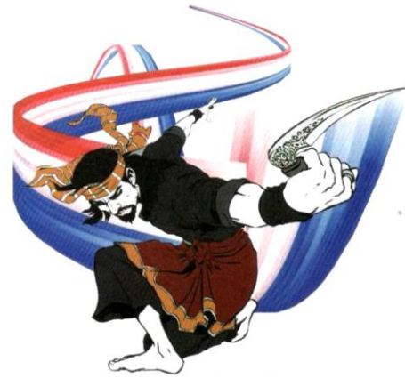
Poster Kejujutan Maya Seni Silat Terbuka Belanda 2021.

Tidak harus dilupakan bahawa silat Melayu pada asalnya ialah seni tempur dan ilmu perang orang Melayu. Seni ini dicipta untuk mempertahankan aqidah, maruah dan pusaka bangsa daripada dijajah penceroboh. Oleh sebab itu, silat bukan semata-mata mempunyai aspek jasmani atau pergerakan fizikal sahaja, tetapi juga diterapkan dengan ilmu spiritual atau keagamaan untuk memperkukuhkan aspek rohani pengamalnya. Selain itu, silat juga menekankan adab dan budaya Melayu yang menjadi teras kepada peradaban dan jati diri Melayu. Hingga kini terdapat ratusan, malahan mungkin ribuan,