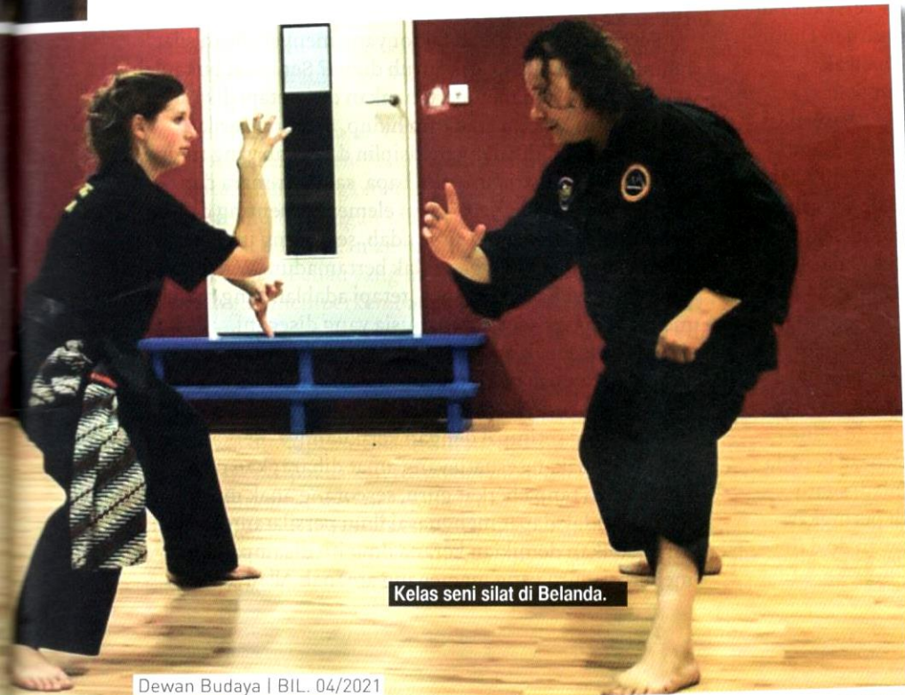
Kelas seni silat di Belanda.

Atas dasar itu, pada tahun 2019, silat diiktiraf sebagai Warisan Kebudayaan Tidak Ketara milik Malaysia oleh Pertubuhan Pendidikan, Saintifik dan Kebudayaan Pertubuhan Bangsa-Bangsa Bersatu (UNESCO). Pada tahun yang sama, pencak silat turut diiktiraf oleh UNESCO sebagai Warisan Kebudayaan Tidak Ketara Indonesia. Hal ini merupakan