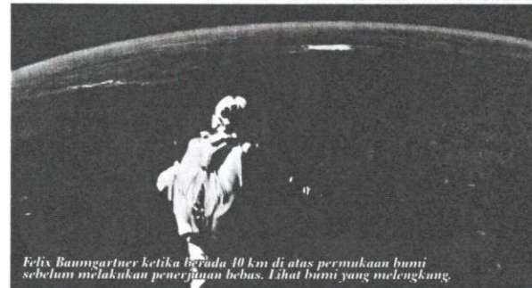
Felix Baumgartner ketika berada 40 km di atas permukaan bumi sebelum melakukan penerjunan bebas. Lihat bumi yang melengkung.

Rakaman kamera dari kapsul yang dinaiki Felix telah menunjukkan bahawa semasa beliau berada pada ketinggian 40 km dari permukaan