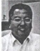
Oleh: MOHD ZAMRI SHAH MASTOR Pegawai Sains Agensi Angkasa Negara (Angkasa)