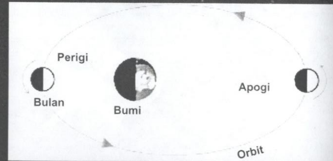
Rajah 2 Kedudukan perigi dan apogi.

Setiap kali Bulan mengorbit Bumi, Bulan melalui titik perigi dan apogi. Dalam tempoh satu tahun, Bulan mengorbit Bumi sebanyak 12 kali. Hal ini bermakna Bulan melalui 12 kali perigi dan apogi dalam tempoh ini. Dalam tempoh satu tahun, titik dan nilai jarak perigi dan apogi ini berubah-ubah setiap kali Bulan mengorbit Bumi. Nilai jarak perigi dan apogi bagi orbit bagi setiap bulan tidak sama. Sebagai contohnya, jarak perigi dan apogi pada bulan Februari tidak sama dengan bulan Mac.