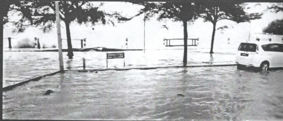
Air laut pasang besar ketika fenomena Bulan purnama gedang.

Ketika fasa ijtimak, Bulan tidak dapat dilihat oleh pemerhati di Bumi kerana bahagian gelap Bulan menghadap Bumi. Fasa purnama pula adalah apabila Bumi