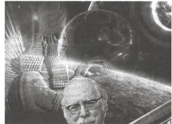
Zecharia Sitchin bersama lukisan pepahat Sumeria

Kajian Zecharia Sitchin ke atas artifak-artifak Sumeria juga, Anunnaki dengan kemajuan pengetahuan dan pemikiran yang mereka miliki, telah menghasilkan Homo Sapiens atau manusia modern kaedah kejuruteraan genetik.