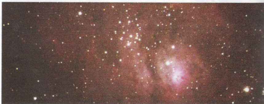
Nebula Lagoon di langit malam pada 5 Mei 2020.

Analisis terhadap parameter pencemar udara utama, iaitu nitrogen dioksida ( \text{NO}_2 ), sulfur dioksida ( \text{SO}_2 ), karbon monoksida (CO) dan habuk halus bersaiz diameter bawah 2.5 mikron ( \text{PM}_{2.5} ) yang dicerap di 65 stesen cerapan bahan cemar udara menunjukkan kadar penuruban yang ketara. Trend bacaan bahan cemar udara bagi \text{NO}_2 , \text{SO}_2 , CO dan \text{PM}_{2.5}