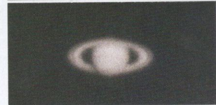
Musytari (atas) dan Zuhal (bawah) dapat dilihat dengan jelas di langit malam pada 12 Mei 2020.

Peningkatan kualiti udara yang lebih baik sepanjang tempoh PKP memperlihatkan langit malam yang lebih cerah daripada sebelumnya. Dalam keadaan langit tidak berawan, bintang-bintang boleh dilihat dengan lebih mudah. Menurut editor majalah Sky at Night yang juga seorang astrofizik, semasa pandemik COVID-19 bintang dapat dilihat dengan pandangan mata kasar apabila langit semakin cerah.