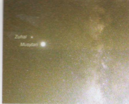
Bimasakti, Musytari dan Zuhal di langit malam pada 19 Mei 2020.

Dalam keadaan langit yang cerah, lebih banyak objek di langit dapat dilihat seperti planet, buruj, kluster bintang dan galaksi. Dalam tempoh PKP, planet Zuhrah, Marikh, Zuhal dan Musytari boleh dilihat dengan pandangan mata kasar dengan mudahnya. Pada fasa satu dalam tempoh PKP (18–31 Mac 2020), planet ini boleh dilihat pada awal pagi sekitar pukul 4.00 pagi di langit timur. Planet tersebut dilihat berdekatan antara satu sama lain. Kemudian, pada 18–22 Mac, Musytari dan Marikh dilihat berdekatan dengan sudut pisahan kurang daripada satu darjah. Antara ketiga-tiga planet tersebut, Musytari paling cerah dengan magnitud -2.1.