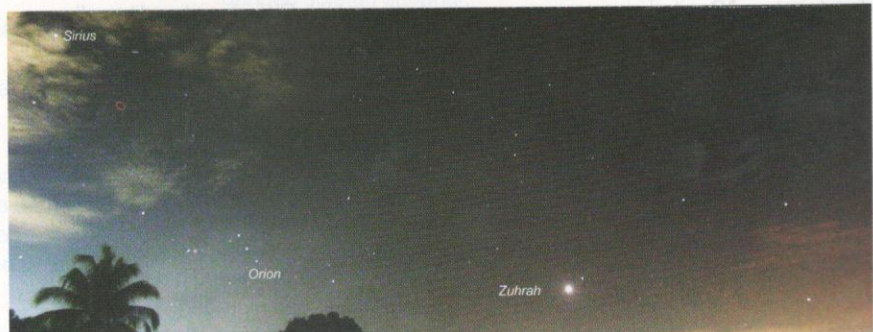
Buruj Orion dan Zuhrah.

Selain itu, kualiti udara yang baik menjadikan langit lebih cerah berbanding dengan sebelum berlakunya pandemik COVID-19. Menurut laporan berita CBS, di Eropah, pengurangan jumlah kenderaan di jalan raya, penutupan stadium, kedai dan pejabat serta penutupan kilang menyebabkan turunnya kadar pencemaran udara. Akibat tiada lagi pembebasan asap kenderaan dan kilang, hal ini membolehkan banyak bintang yang dapat dilihat dengan lebih jelas dan panorama ini cukup mengagumkan terutama di kawasan bandar dan pinggir bandar yang sebelumnya banyak yang tidak pernah melihatnya.