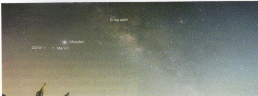
Galaksi Bimasakti dan planet.

di tiga stesen di Lembah Klang menunjukkan penurunan hingga 27 peratus bagi parameter SO_2 ; penurunan hingga 70 peratus bagi parameter NO_2 ; penurunan hingga 49 peratus bagi parameter CO; dan penurunan hingga 29 peratus bagi parameter PM_{2.5} .