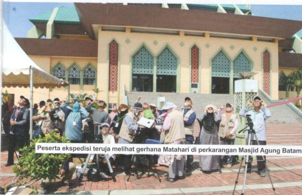
Peserta ekspedisi teruja melihat gerhana Matahari di perkarangan Masjid Agung Batam.