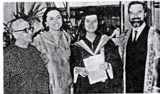
Zeti mendapat sokongan dan dukungannya penuh daripada ibu bapanya yang merupakan tokoh ilmuwan negara.

Kadar hutang tidak berbayar bagi bank di Malaysia turut meningkat sehingga banyak bank mengalami masalah kewangan. Pelabur asing pula menarik pelaburan mereka