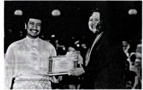
Zeti dinobatkan sebagai Tokoh Maal Hijrah 1432.

Pada tahun 2014, beliau menerima dua anugerah terbilang yang mengiktiraf kepimpinan beliau dalam bidang kewangan sebagai tokoh bank pusat. Anugerah tersebut ialah Anugerah Kejayaan Sepanjang Hayat oleh Perdana Menteri Emiriah Arab Bersatu (UAE) dan Pemerintah Dubai, Mohammed Rashid Al-Maktoum, dan pada tahun 2015, Tan Sri Zeti menerima Pingat Dekan Wharton, Universiti Pennsylvania, yang merupakan anugerah tertinggi yang diberikan oleh universiti tersebut kepada mantan pelajar yang memberikan impak yang cukup besar terhadap bidang masing-masing. Pada Januari lalu, iaitu kira-kira empat bulan sebelum kontrak perkhidmatannya sebagai Gabenor BNM untuk tempoh lima tahun tamat, Tan Sri Zeti sekali lagi dikurniakan Anugerah Sepanjang Hayat oleh Jurnal Bank Pusat ,