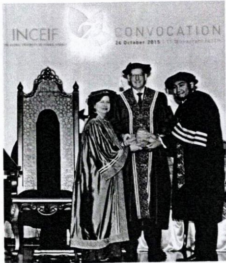
Zeti berharap lebih banyak pakar dalam bidang kewangan Islam dapat dilahirkan menerusi INCEIF.

bank Islam asing dibenarkan membuka operasi di Malaysia. Hal ini membolehkan banyak produk kewangan Islam terbaharu dan berinovasi turut diperkenalkan oleh bank tempatan yang sebelum ini lebih berorientasikan sistem kewangan konvensional.