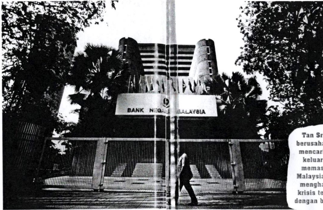
BNM bertanggungjawab mengawal selia sistem kewangan dan ekonomi negara.

Malaysia juga tidak terkecuali apabila ringgit Malaysia (RM) merosot hampir sekali ganda menyebabkan banyak rakyat Malaysia, terutamanya golongan usahawan dan ahli perniagaan, terjejas. Disebabkan kejatuhan mendadak RM, maka hutang syarikat meningkat dengan ketara sehingga banyak syarikat tidak lagi mampu membayar hutang mereka.