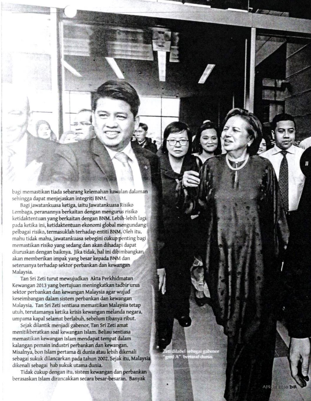
Zeti dilabel sebagai gabenor "great A" bertaraf dunia.

Tidak cukup dengan itu, sistem kewangan dan perbankan berasaskan Islam diraccakkan secara besar-besaran. Banyak