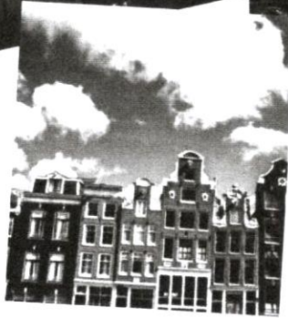
Bahagian depan rumah Belanda yang ikonik - bertebat layar besar, berwarna-warni dan sempit bukannya di depan.

Selain itu, saya menyaksikan kesibukan pelabuhan yang dianggap kedua tersibuk di dunia ini. Kapal-kapal memenuhi tempat pemunggaan, dan masih banyak lagi kapal di luar yang menunggu dengan sabar.