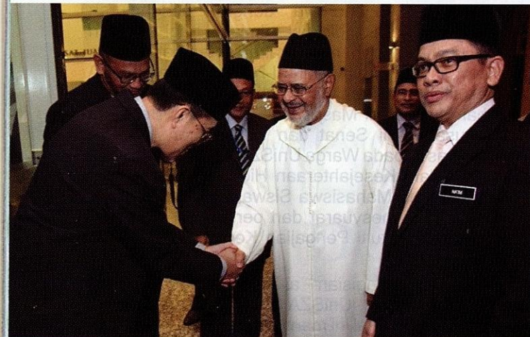
Al-Raissouni menghadiri program anjuran Jabatan Kehakiman Syariah Malaysia.