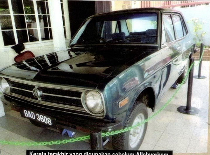
Kereta terakhir yang digunakan sebelum Allahyarham P. Ramlee meninggal dunia.