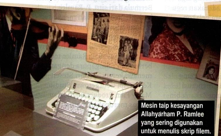
Mesin taip kesayangan Allahyarham P. Ramlee yang sering digunakan untuk menulis skrip filem.

ANM menempatkan kerusi di bahagian luar bangunan untuk kegunaan pelawat berehat. Setiap kerusi tersebut dihiasi dengan tulisan pelbagai tajuk filem dan lagu yang pernah dipopularkan oleh Allahyarham. Antara tajuk filem yang tertera pada bahagian kerusi termasuklah Anakku