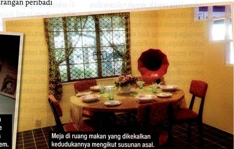
Meja di ruang makan yang dikekalkan kedudukannya mengikut susunan asal.