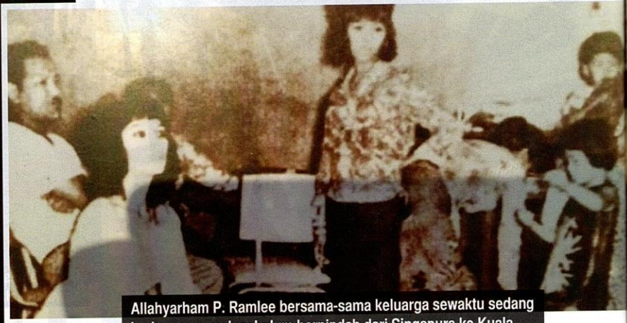
Allahyarham P. Ramlee bersama-sama keluarga sewaktu sedang berkemas rumah sebelum berpindah dari Singapura ke Kuala Lumpur pada tahun 1964.

Sazali, Kanchan Tirana, Masam-masam Manis, Nasib Si Labu Labi, Musang Berjanggut dan Laksamana Do Re Mi; manakala tajuk lagu ialah Bunyi Gitar, Joget Si Pinang Muda, Merpati Dua Sejoli, Malamku Bermimpi, Gelora dan Kasihnya Ibu.