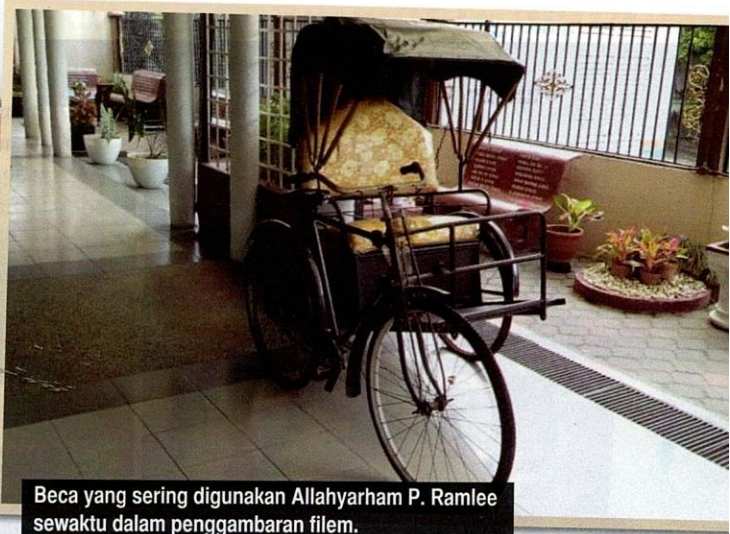
Beca yang sering digunakan Allahyarham P. Ramlee sewaktu dalam penggambaran filem.

Penubuhan Pustaka Peringatan P. Ramlee (PPPR) di atas tapak bekas banglonya di Jalan Dedap, Setapak, Kuala Lumpur merupakan langkah tepat bagi mengubat kerinduan yang semakin bersarang terhadap susuk terbilang industri perfileman Melayu ini. Allahyarham mendiami banglo tersebut bersama-sama isterinya, Biduanita Negara Allahyarhamah Saloma setelah berpindah dari Singapura. Premis sejarah yang diletakkan di bawah kawal selia Arkib Negara Malaysia (ANM) ini mula dibuka kepada orang ramai pada 22 Mac 1986, setelah melalui beberapa fasa pemulihan dan penambahbaikan. Penubuhannya juga didorong oleh cadangan ANM sebagai menghargai peranan Allahyarham yang tidak ternilai dalam bidang seni perfileman Melayu dan membolehkan generasi