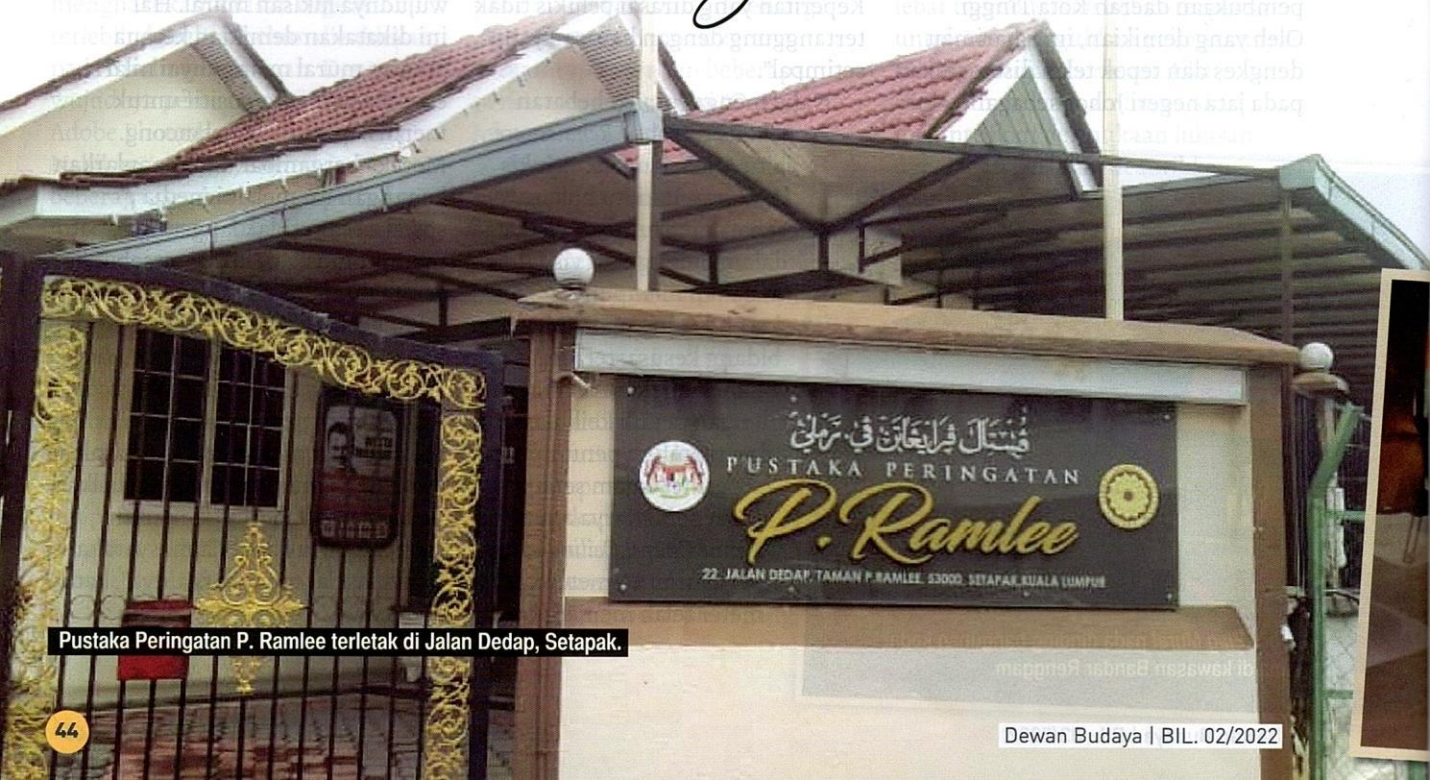
Pustaka Peringatan P. Ramlee terletak di Jalan Dedap, Setapak.