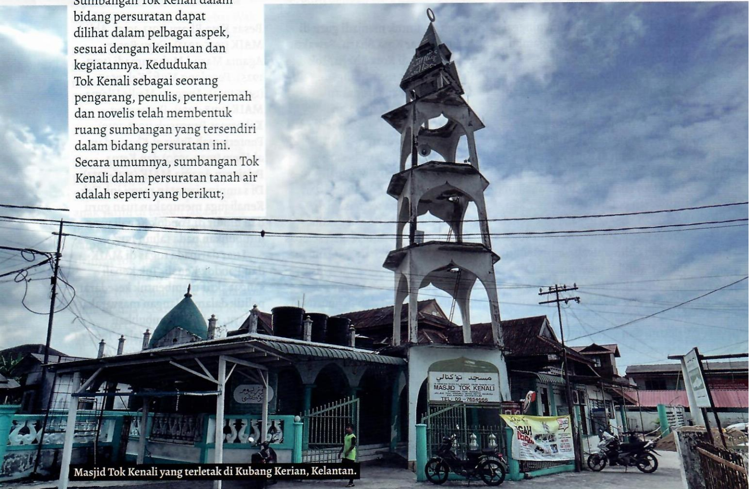
Masjid Tok Kenali yang terletak di Kubang Kerian, Kelantan.