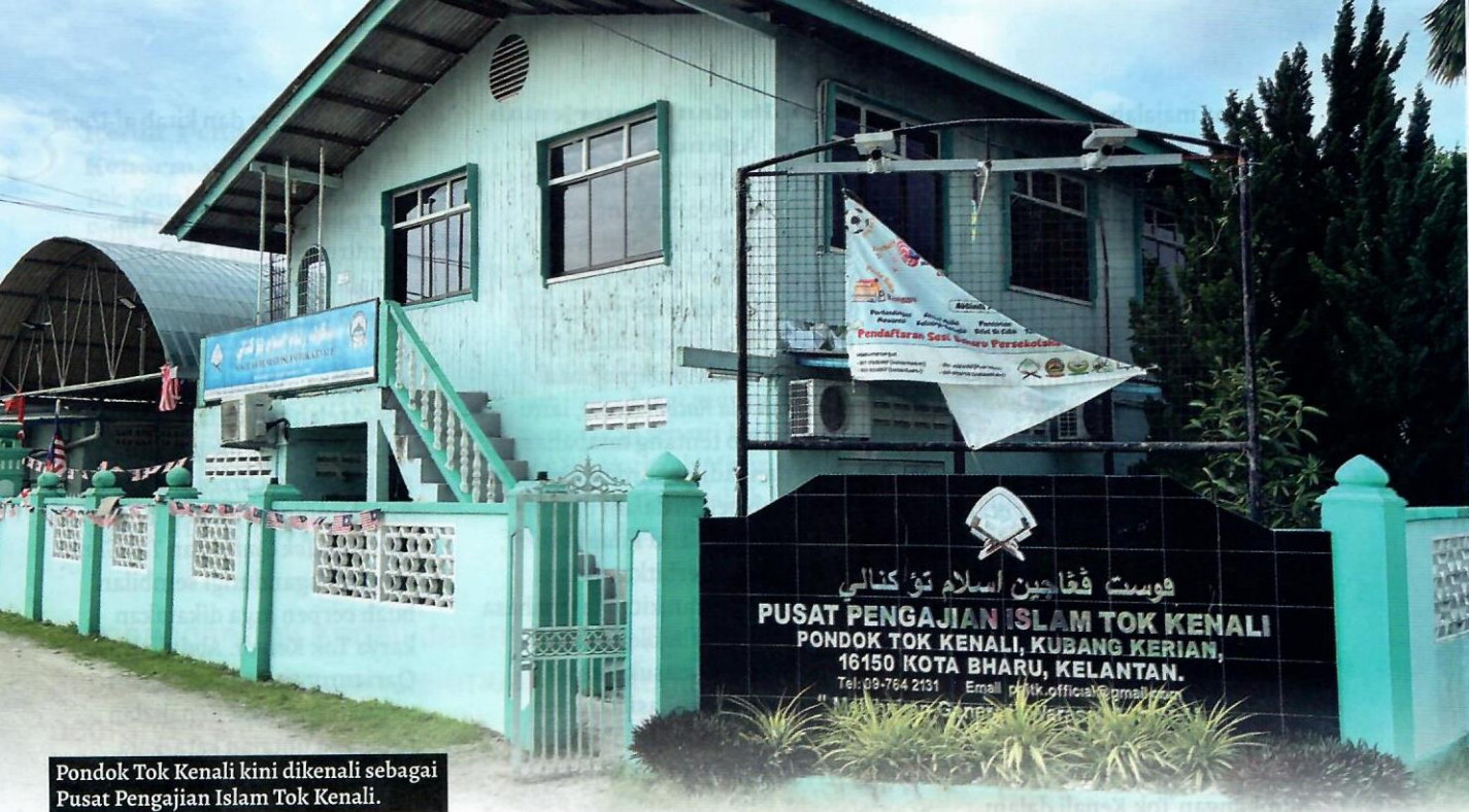
Pondok Tok Kenali kini dikenali sebagai Pusat Pengajian Islam Tok Kenali.

Ahmad al-Fathani telah meninggal dunia, lalu Tok Kenali mengambil keputusan untuk kembali ke Kelantan pada tahun 1909.