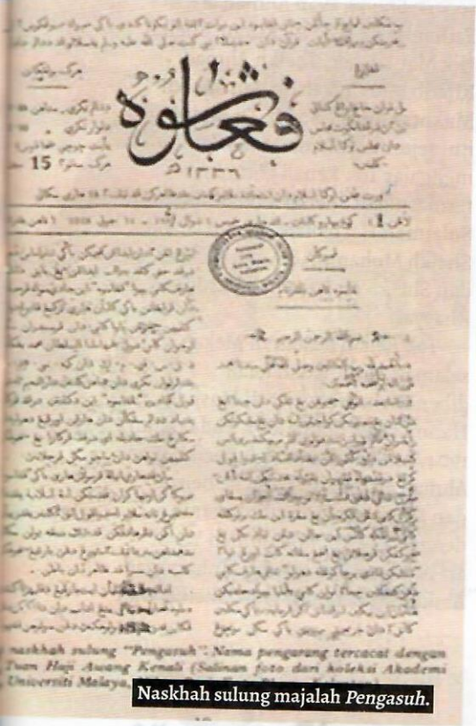
Naskah sulung majalah Pengasuh.

Islam di negara ini, belum banyak sarjana yang meneliti dan menggalurkan sumbangan Tok Kenali dalam bidang persuratan. Walaupun sebenarnya Tok Kenali melihat jauh ke hadapan bahawa satu daripada wahana yang penting dalam menggerakkan pemikiran orang Melayu yang "sedang tidur" itu adalah melalui persuratan.