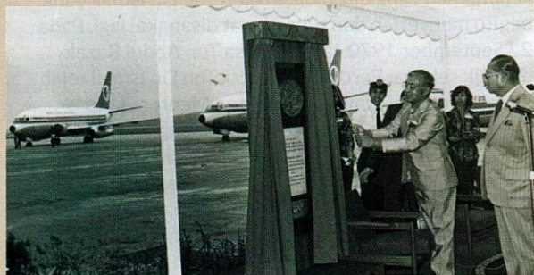
Tun Dr. Ismail ketika menyempurnakan Upacara Pelancaran Rasmi Sistem Penerbangan Malaysia (MAS) di Lapangan Terbang Antarabangsa Kuala Lumpur, Subang, pada 30 September 1972.