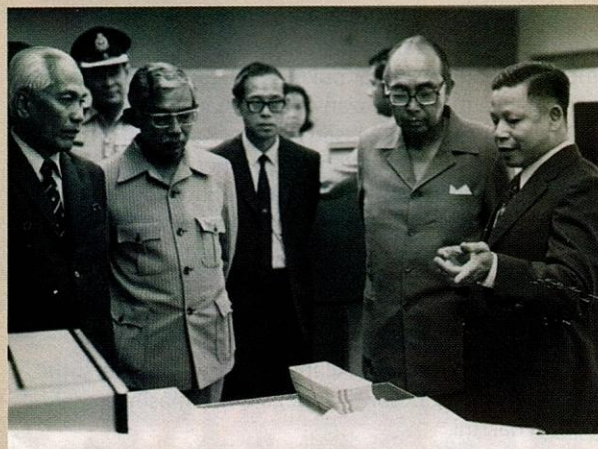
Tun Dr. Ismail (tiga dari kiri) dan Tun Abdul Razak (dua dari kanan) semasa melawat Lembaga Letrik Negara di Jalan Bangsar, Kuala Lumpur, pada 28 Mac 1973.