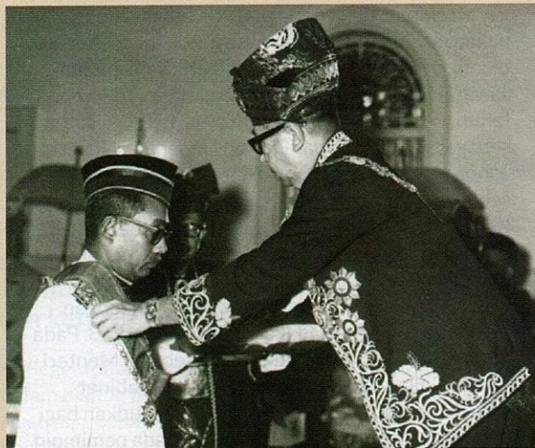
KDYMM Sultan Ismail Nasiruddin Shah ibni Almarhum Sultan Zainal Abidin, Yang di-Pertuan Agong menganugerahkan Darjah Seri Setia Mahkota (S.S.M.) yang membawa gelaran Tun kepada Tun Dr. Ismail Dato' Haji Abdul Rahman di Istana Negara, Kuala Lumpur, pada 8 Jun 1966.