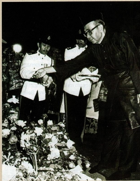
Tun Abdul Razak menyiramkan air di pusara Allahyarham Tun Dr. Ismail di Makam Pahlawan, Masjid Negara, Kuala Lumpur, pada 4 Ogos 1973.