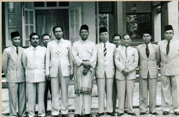
Tun Dr. Ismail (dua dari kiri) bersama-sama ahli rombongan merdeka sebelum berangkat ke London untuk menyertai Persidangan Meja Bulat pada 18 Januari 1956.